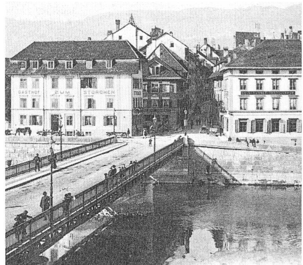
Wengibrücke mit Landhausquai. (Alte Postkarte, Ed. Phot. Franco-Suisse, Bern).

Gestützt auf diese Protokollhinweise mussten die Namenänderungen zwischen