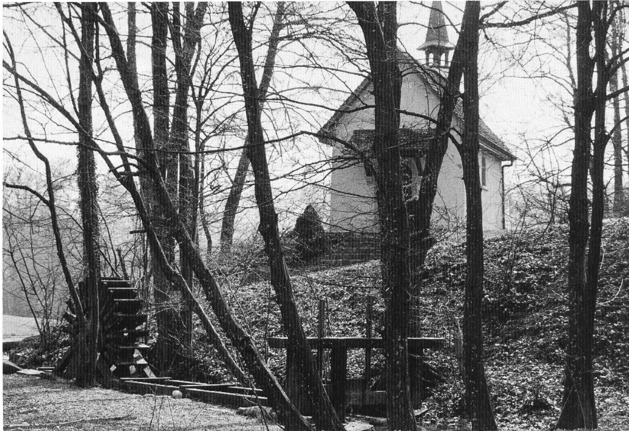
Käppeli mit Wasserrad