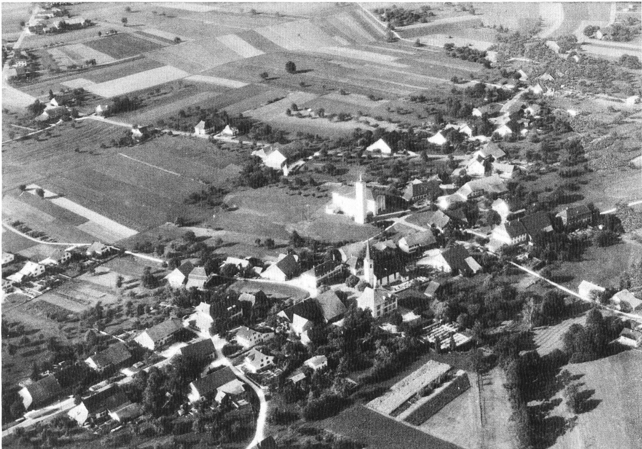
Fulenbach — die Heimat von Beat Jäggi — um 1963