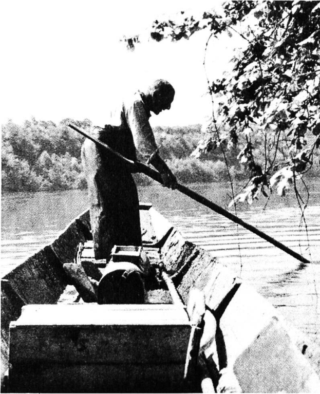
Der letzte Kaiseraugster Berufsfischer auf dem Rhein. Bis kurz vor seinem Tod vor wenigen Jahren war er täglich draussen auf dem Rhein.

bot die Fischerei und Flösserei der Bevölkerung willkommenen Zusatzverdienst. Schon im Mittelalter schlossen sich die Fischer, später die Schiffer und Flösser, zu zunftähnlichen Rheingenossenschaften zusammen. Ihre schriftlich niedergelegten Satzungen regelten Rechte und Pflichten. Fische wurden in die Stadt und Landschaft Basel geliefert. Mächtige Flösse aus den holzreichen Gegenden des Jura und Schwarzwaldes wurden rheinabwärts bis Holland geschickt. Mitte des letzten Jahrhunderts passierten jährlich etwa 2000 Flösse die Zollstelle Kaiseraugst. Für jeden Baumstamm mussten 32 Kreuzer entrichtet werden. Rheinvogt, Säckelmeister und Schreiber walteten ihres Amtes als hochangesehene Repräsentanten der Rheingenossen. Ämter, die in den letzten 400 Jahren meist von Kaiseraugst ausgeübt wurden. Die Familie des letzten Rheinvogtes wird heute noch respektvoll «s'Rhywaibels» genannt.