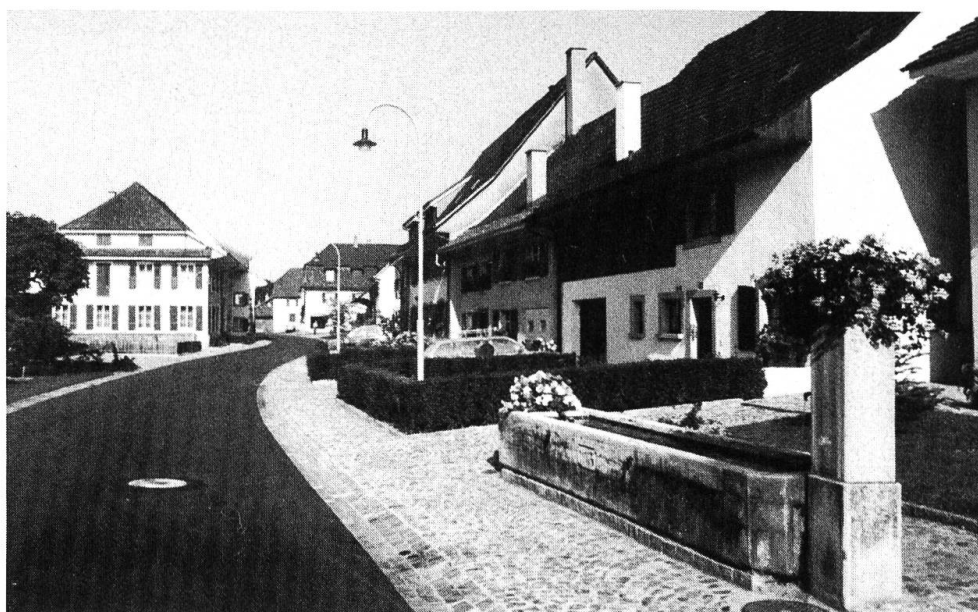
An der Dorfstrasse.

Der Wohnungsbau entwickelte sich anfänglich bescheidener. Im Dorf ist bis heute das Bauern- oder Gewerbehaus vorherrschend. An der Peripherie entstanden Einfamilienhäuser und einige Mehrfamilienhäuser mit Eigentumswohnungen. Die Einwohnerzahl stieg nur unwesentlich auf ca. 1000 im Jahre 1970. Das änderte sich 1976 mit den