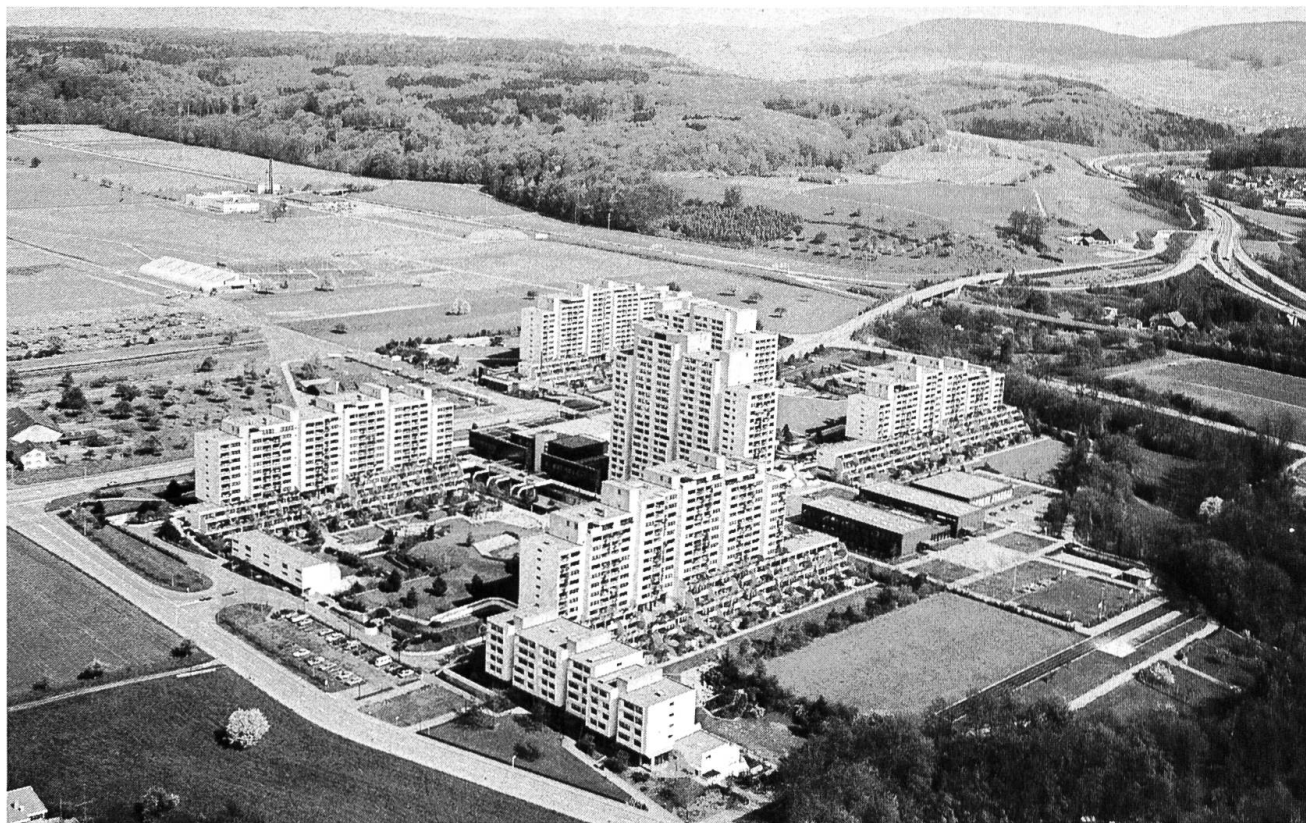
Die in den 70er Jahren erstellte Überbauung Liebrüti. 880 Wohnungen und eine gut ausgebaute Infrastruktur kennzeichnen das neue Kaiseraugst. Oben rechts die Verzweigung der Autobahn Richtung Bern/Zürich. Ca. Bildmitte die Schulanlage.

269 m ü. M. Gemeindebann: 491 ha, davon Wald: 153 ha. Einwohner: 3240 davon Ortsbürger: 342 Ausländer: 439 Bevölkerungsentwicklung: 1900: 595 1930: 719 1975: 1220