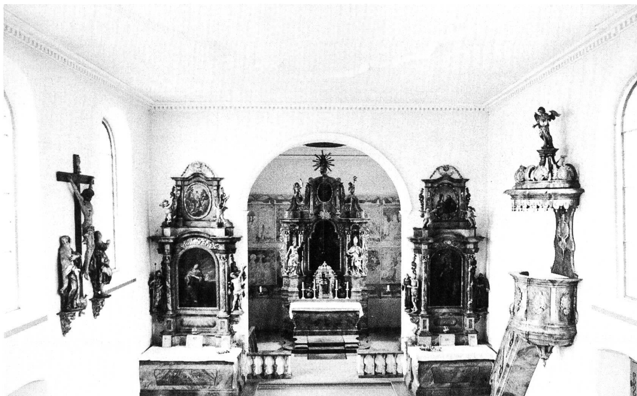
Inneres mit farbenfroher, barocker Ausstattung, gegen Mitte des 18. Jh. (Foto A. Lüscher, Kaiseraugst).

Die anderen 5 Häuser standen westlich der alten Römerbrücke über die Ergolz, ein kleiner Weiler an der Strasse nach Basel, «Augst an der Brücke» genannt. Ein markanter Wendepunkt in der Geschichte der beiden Augst brachte das Jahr 1442, indem durch Verkauf der östliche Teil, Augst im Dorf, österreichischer Besitz wurde. Die damals festgelegten Grenzen entlang Violenbach und Ergolz sind noch heute als Kantonsgrenze AG/BL gültig. Die nunmehrige Zugehörigkeit zu den «Kaiserlichen» führte zur Ortsbezeichnung Kaiseraugst. Augst an der Brücke blieb bei Basel und wurde zum heutigen Baselaugst.