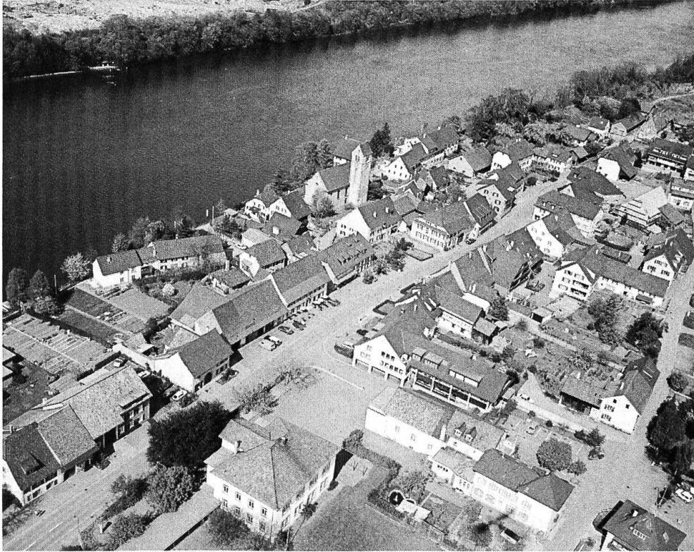
Am unteren Bildrand, Mitte, das Schulhaus im Dorf. Bildmitte gegen Rhein, die Galluskirche.