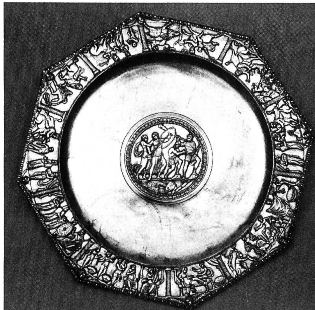
Achilles-Platte: Silber, massiv gegossen, 53 cm Durchmesser. (Foto: Römermuseum Augst).

Prunkstück ist der inzwischen weltberühmte Silberschatz von Kaiseraugst. Ein sensationeller Fund, auf abenteuerliche Weise eher zufällig entdeckt. Im Winter 1961/62 fand ein Schüler in einem Haufen Aushub eine Art VW-Raddeckel. Beim nachträglichen Waschen kam eine fein ziselierte Silberschale zum Vorschein. Dank der Benachrichtigung der Archäologen durch eine auf