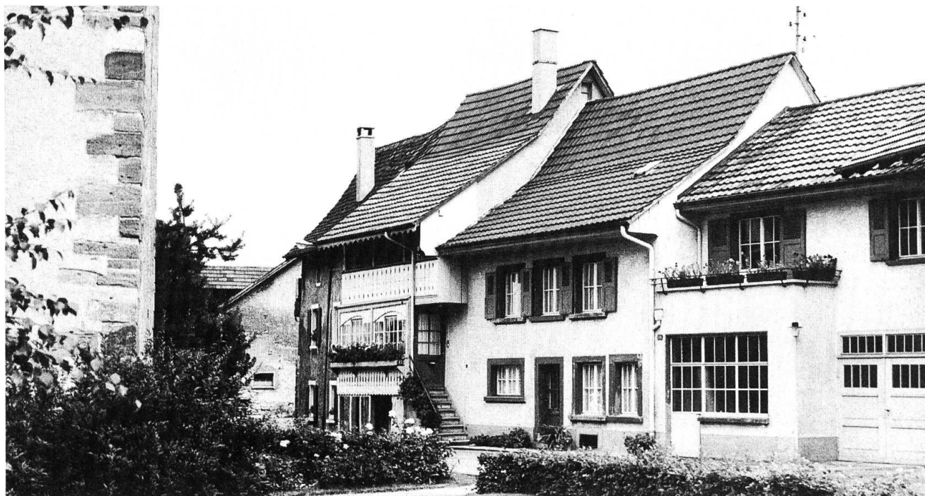
Häusergruppe gegenüber der Kirche.

In den 50er Jahren schuf Kaiseraugst einen der ersten Zonenpläne des Kantons Aargau. Die expandierende Grossindustrie hatte das Fricktal als idealen Standort entdeckt. Dank Baureglement und Zonenplan konnte Erschliessung und Bebauung koordiniert und finanziell gesichert abgewickelt werden. Ein grosses Industrieareal, im Besitz der Ortsbürgergemeinde, konnte so schrittweise nach erfolgtem Kiesabbau, im Baurecht auf 99 Jahre, abgegeben werden. Heute sind über 1000 Arbeitsplätze im Industrieort Kaiseraugst installiert. Das Angebot