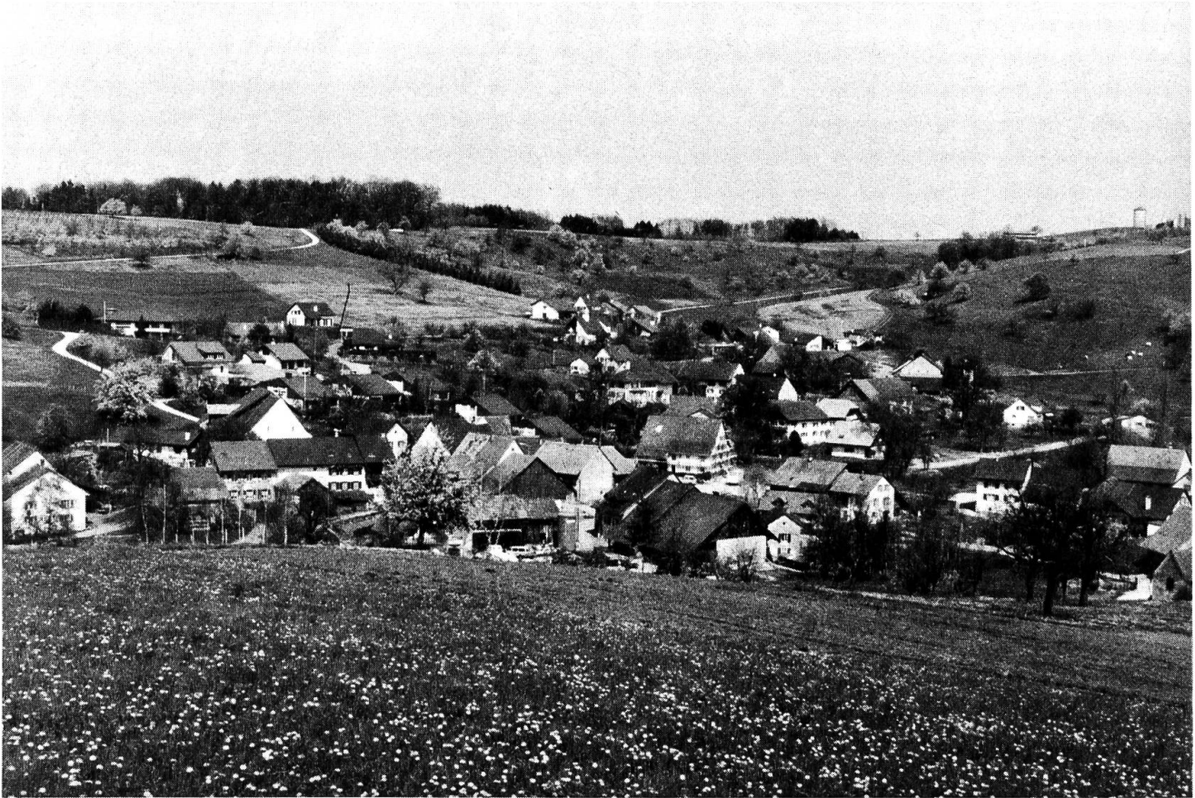
Olsberg aus Südwesten.