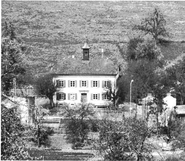
Schul- und Gemeindehaus.

geschoben werden. Die Gemeinde erstellte unterhalb des Stifts eine mechanisch-biologisch arbeitende Kläranlage. Mit der Verlegung von Abwasserleitungen wurden gleichzeitig veraltete Trinkwasserleitungen ersetzt, die Hydrantenanlage erweitert und die Verkabelung der Elektrizitätsversorgung vorgenommen. Nach diesen aufwendigen Realisierungen wurden die Dorfstrasse schrittweise ausgebaut und mit Asphalt belegt. In jüngerer Zeit verschwanden zunehmend, aus Gründen des Unterhaltes, Naturwege und -strassen unter einer Teerschicht.