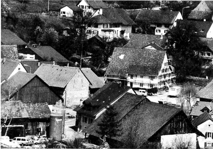
Dorfkern; das Dorfrestraurant im Umbau.

scheinen diese Annahme zu bestätigen. Der einzige gesicherte Hinweis auf römische Besiedlung liefern uns die Grabungsergebnisse in der Klosterrüttenen. Die gefundenen Mauerreste sind Überreste einer römischen Villa. Die Räume waren ebenerdig angelegt. Neben einer grösseren, mit Sandstein umrandeten Feuerstelle wurde auch eine kleinere, teilweise zerstörte Feuerstelle gefunden. Die Funde deuten auf eine längere Benützungsdauer hin.