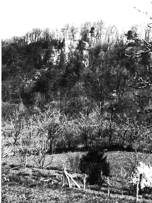
Die «rote Fluh».