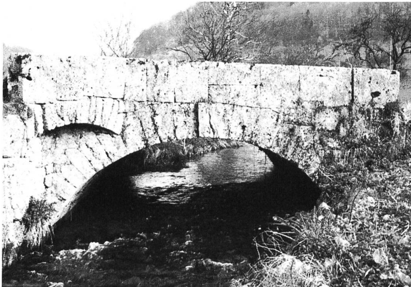
Die «Hohle Brücke» über der noch jungen Ergolz. Hier verlief bis im Jahr 1534 die Gaugrenze. Rechts der Brücke herrschten die Habsburger (Frickgau), links die Basler (Sissgau).

stein half dem Domkapitel bei Erbstreitigkeiten um den Meierhof. Als Dank übertrug das Domstift den ganzen Hof dem Haus Thierstein, das zuerst die Familie Kunigenstein (Boos Nr. 487), dann die Familie Friedinger damit belehnte.