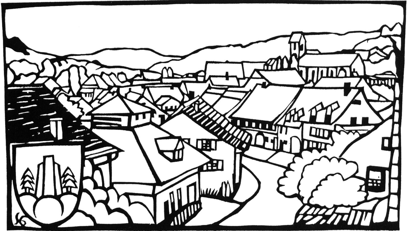
Scherenschnitt von Sigrid Graf-Erny, nach einem Gemälde von Alfred Gass (1912–1987). Eine schöne Ansicht von Rothenfluh. Die Ruebgasse als Fortsetzung der Hirschengasse in der Bildmitte. Das «Theboldshus» zeichnet sich als typisches Baselbieterhaus ab.

Der «Rennweg» ist die heute noch benützbare Verbindung Tal–Anwil: Oltwäg. Weitere Spuren führen ins Dübachtal.