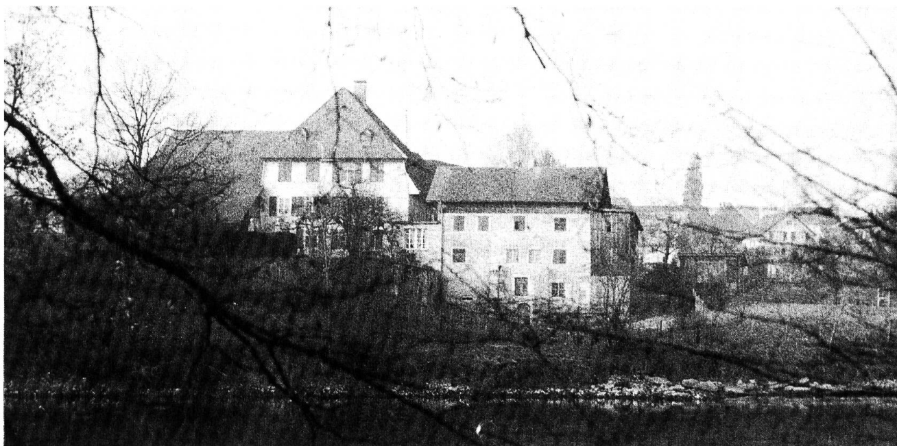
An der bedrohten Wolfwiler Aare: die alte Mühle (rt.), angelehnt an den Patrizier-Landsitz aus dem 18. Jahrhundert, heute das Gasthaus zum Kreuz mit schönem Ausblick auf die Aare.