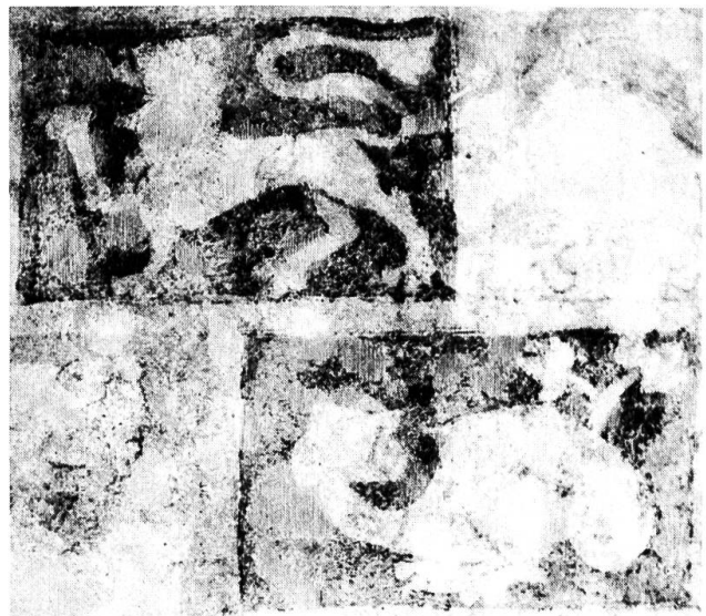
7/8 Quadermalerei an der Südwand im Erdgeschoss, zwei Ausschnitte.