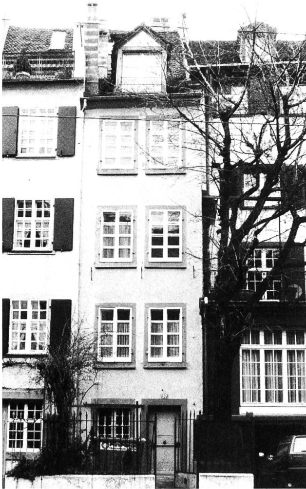
2 Die Hausfassade am Leonhardsgraben.

zwischen den Wappen sind konzentrische Kreise wie übergrosse Nieten hingemalt. Den Zwischenraum zur Decke hin füllt ein quaderartig eingeteiltes Register mit einfachen geometrischen Mustern. Entsprechend war auch die Wappenmalerei an ihrem untern Rand gefasst, wie der gerade noch erhaltene Ansatz belegt.