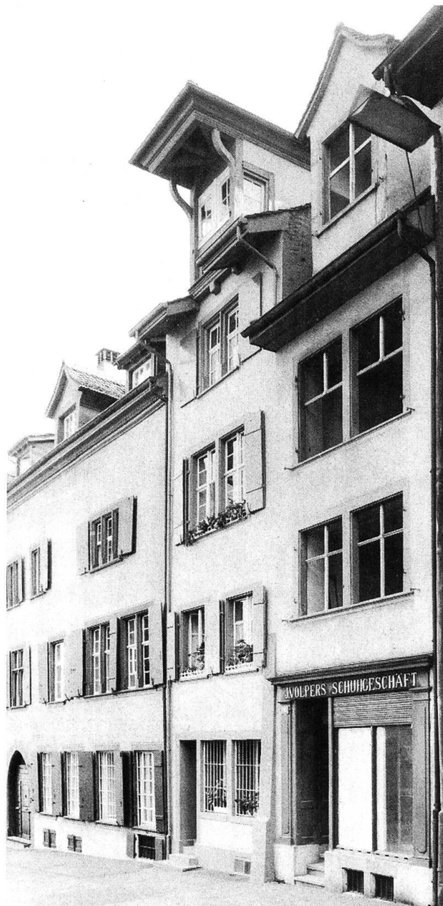
1 Oberer Heuberg 19-21.

Im übrigen hat die Untersuchung in der jetzt ermöglichten Form erst teilweise Klarheit über die Grössenentwicklung des Hauses ergeben. Zur Zeit der hier vorzustellenden Bemalung der Räume – um 1300 – wies das Haus mindestens zwei gemauerte Geschosse und einen Keller auf. Erstaunlicherweise wurde damals die noch in Funktion stehende Stadtmauer als Rückwand des Hauses benützt. Die Breite von rund 3,5 m ergab sich aus dem Umstand, dass die Nebenparzellen schon vor 1300 zum Teil mit Gebäuden belegt waren. Im bemalten Raum im Erdgeschoss waren die Balken anders als üblich vom Heuberg zur Stadtmauer hin gelegt, nicht zwischen die Brandmauern gespannt. Für den Zustand zu jener Zeit müssen wir uns einen längsschmalen und schlecht beleuchteten Raum vorstellen; Fenster waren nur an der Heubergseite vorhanden.