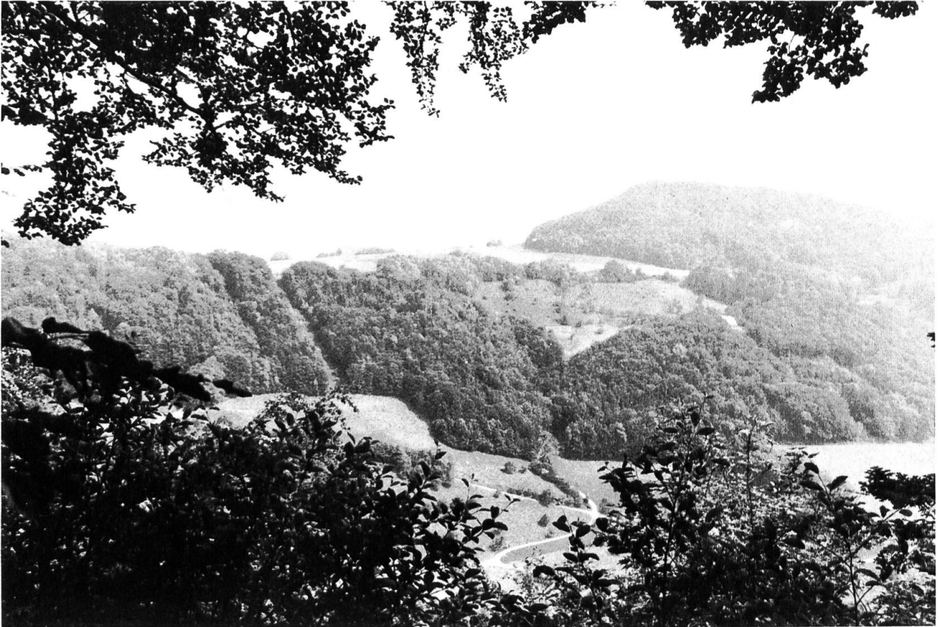
Die Schafmatt vom Wallmattberg (südwestlich von Rohr) aus gesehen mit der steilen Südrampe an der Dürrhalden.