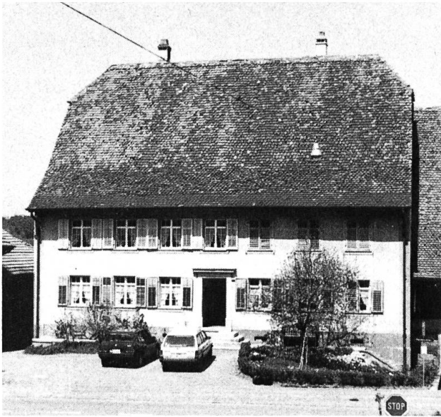
Das Haus Erb.