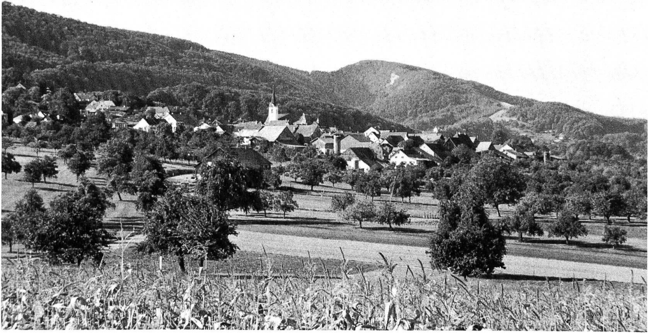
Dorfansicht von Nordwesten.