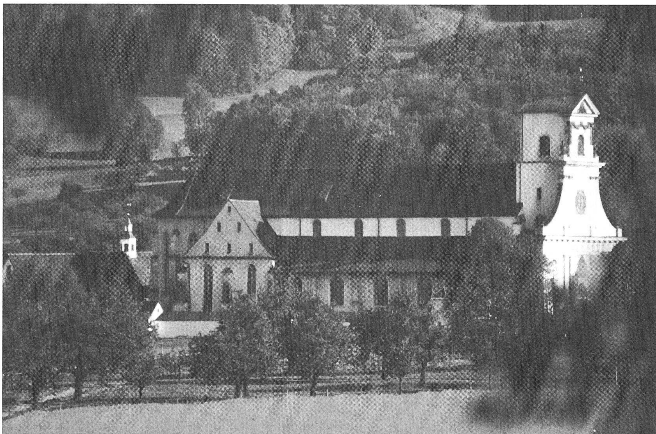
Klosterkirche Mariastein.