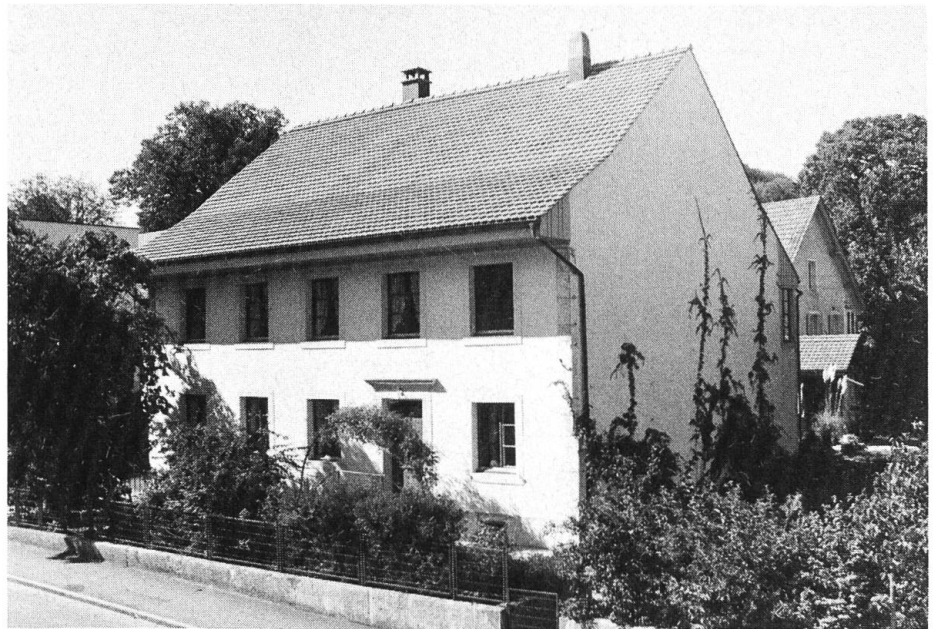
Die Anstalt St. Lorenz in Rickenbach, eröffnet 1892, heutiger Zustand.

thurnischen Kantonsrat aus dem Amt entfernt worden war.