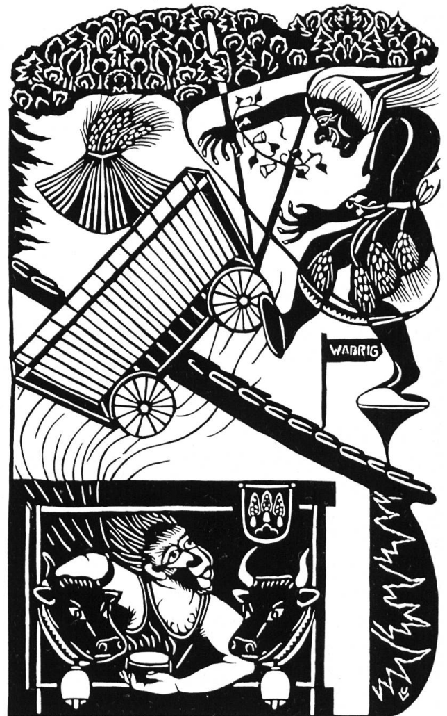
H. Vöglin 1990

Plötzlich polterte es im Hof. Türen klapperten und ein Luftstoss blies den Knecht fast um. Entsetzt rannte er nach draussen. «Der Wagen . . .!» stammelte der Mann. Ja, der Leiterwagen hob sich in die Lüfte und schwebte über Hellikon auf den Berg zu. Der Knecht rannte hinterher als würde er fliegen. Oben, am Waldrand, sah er seine