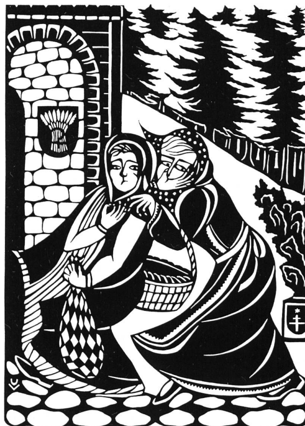
U. Vögeli 1991

«Die schwarzen Balken der Riegelhäuser hoben sich deutlich im Sonnenlicht von den weissen Fachwerkwänden ab. In den Gärten standen verwelkte Blumen, versteckt zwischen Unkraut. Oh, überall die dunklen