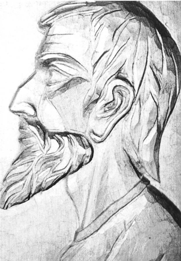
Flachrelief: Bruder Klaus, patiniert.