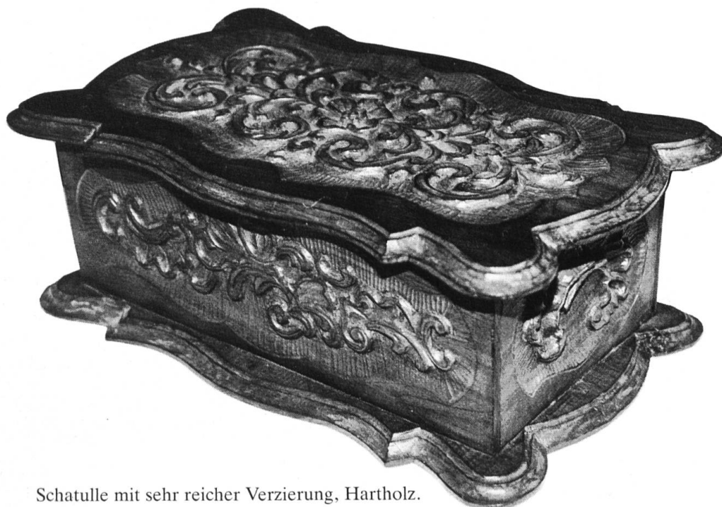
Schatulle mit sehr reicher Verzierung, Hartholz.