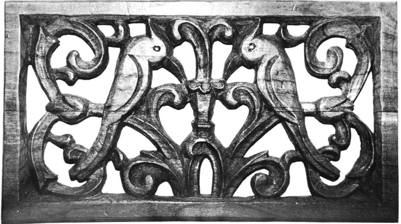
Wandfries aus Hartholz.