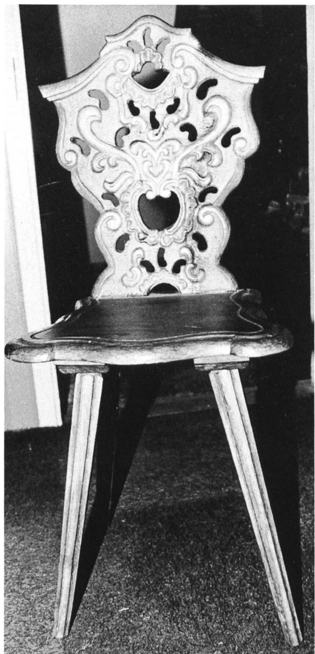
Stabelle aus massivem Hartholz.