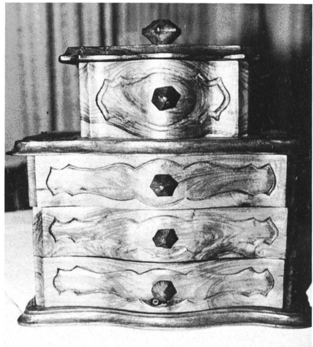
Kredenz in schön geschwungener barocker Linie.