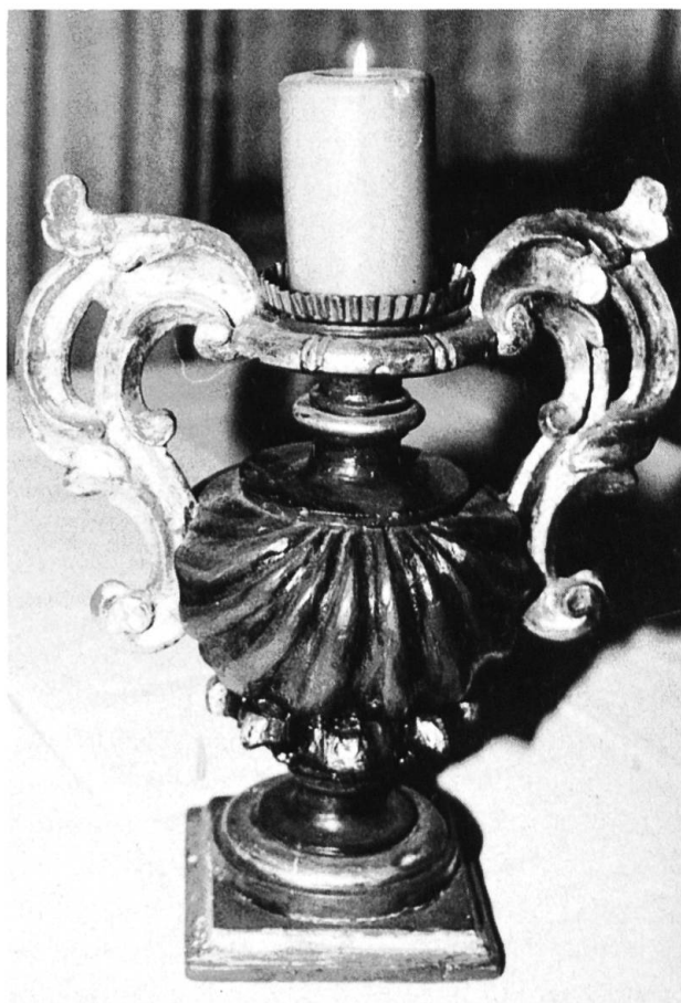
Verschiedenfarbig bemalter und vergoldeter Kerzenstock aus Holz, (35 cm).

Auf seinen Geburtstag hin wollen wir nun seiner kunsthandwerklichen Tätigkeit gedenken. Er kannte sich in vielen Kunsthandwerken aus und übte sie auch selber aus. In grosser Vielfalt entstanden in seiner Werkstatt eine grosse Zahl von Werken, die nun seine Wohnung an der Rennmattstrasse in Laufen bereichern und verschönern. Selten ist er mit seinem Schaffen an die Öffentlichkeit getreten, ausser einmal im Brauereikeller in Laufen und in einem alten Bauernhaus in Zwingen. Er hat nie etwas von seinen Werken verkauft, höchstens verschenkt.