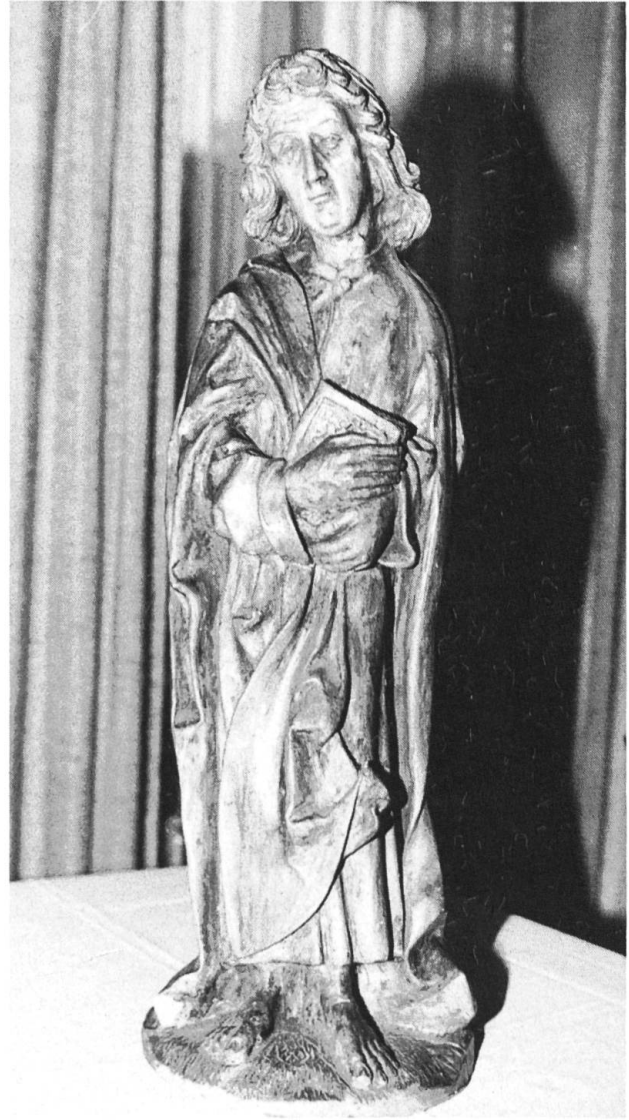
Grosse Johannesfigur aus Laufener Ton (70 cm).