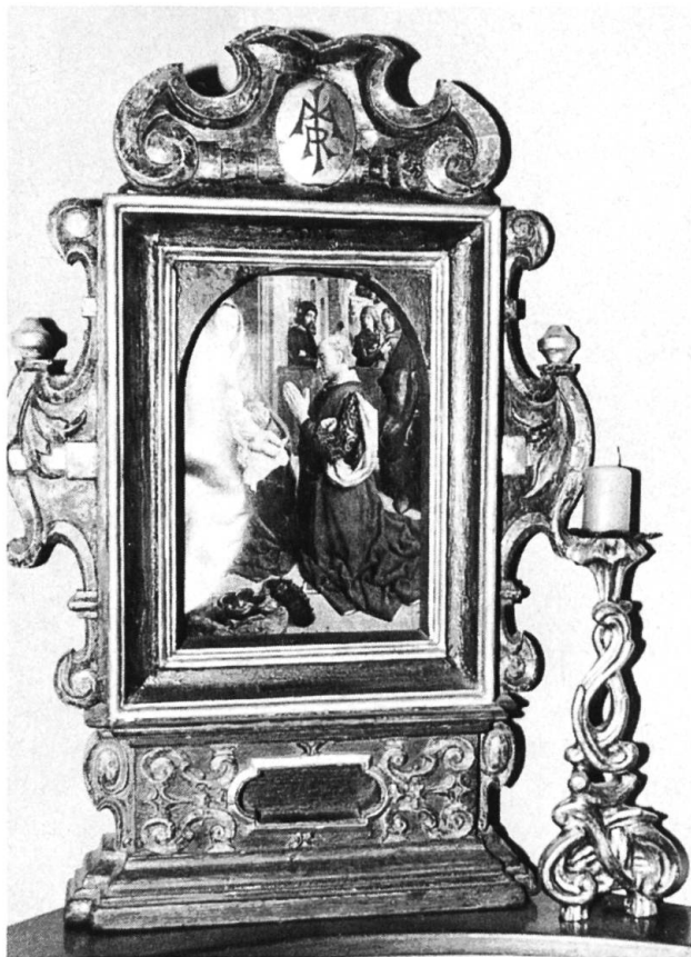
Restauriertes Hausaltärchen und verschlungener Kerzenständer (75 cm).