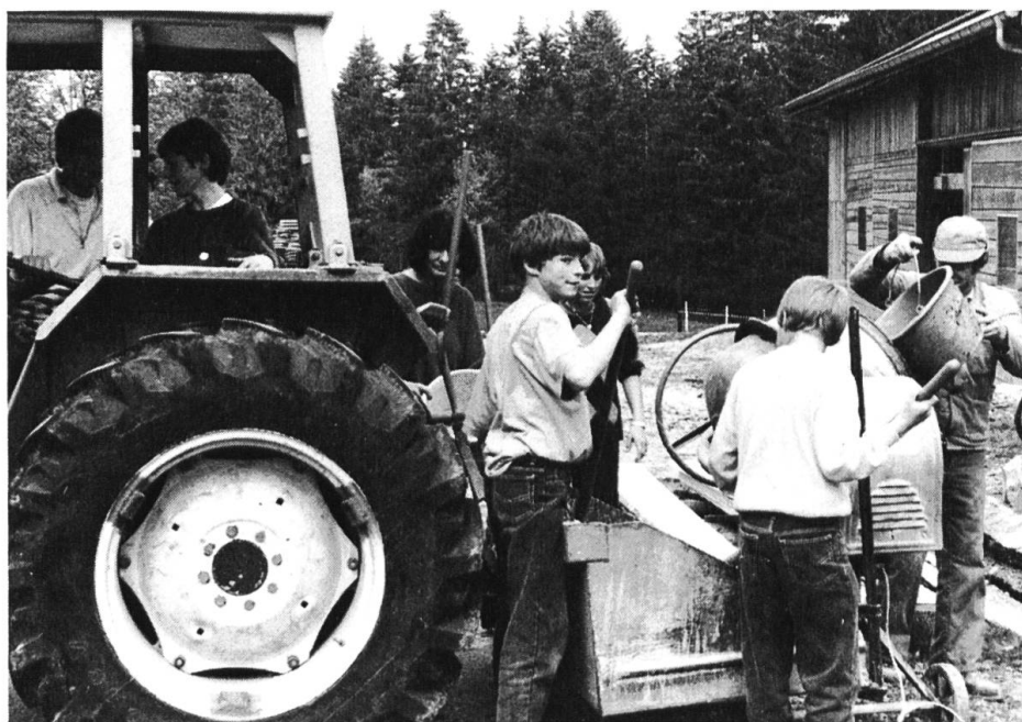
Lehrerin und Schüler im Einsatz auf den Cortébert-Weiden

Hier oben sieht die Welt noch heil aus. Talwärts weniger: Ich betreue eine Freundin, die HIV-positiv ist, eine Cousine in der Scheidung. Ich selber schöpfe aus einer herrlichen Umgebung Kraft und ich versuche das mit anderen irgendwie zu teilen. Auch meinem Sohn musste ich bei Drogenproblemen beistehen. Ich habe Angst und ich rede aus Erfahrung, dass meine Schüler, die in idealen Verhältnissen aufwachsen, nicht lernen, sich