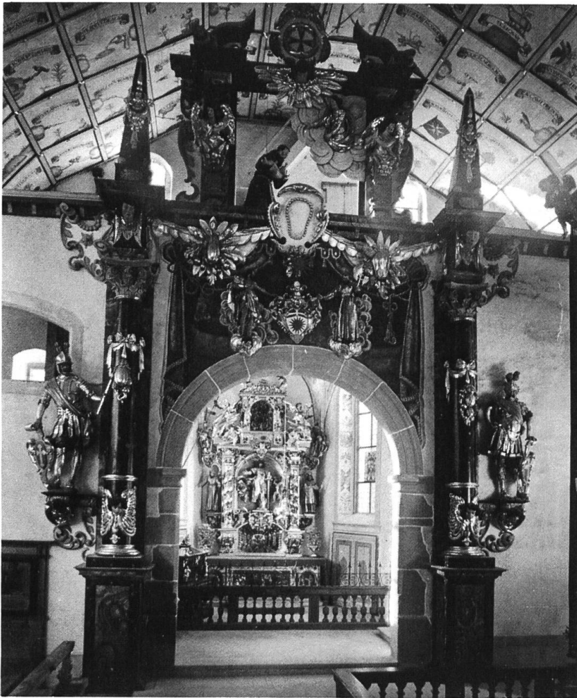
Abb. 3 Hergiswald, Blick vom Kirchenschiff nach Westen in die Felixkapelle. Links und rechts des Triumphbogens die Statuen der Solothurner Stadtpatrone Urs und Viktor.

vinzkapitel stellte sich aber vor die Angeklagten, nahm P. Ludwig vorerst aus der Schusslinie und versetzte ihn als Guardian nach Freiburg. Der Nuntius sowie die Orte Luzern, Solothurn und Freiburg nahmen sich der Sache an und erreichten schliesslich ein päpstliches Breve, das am 15. Januar 1645 die Zitation rückgängig machte.