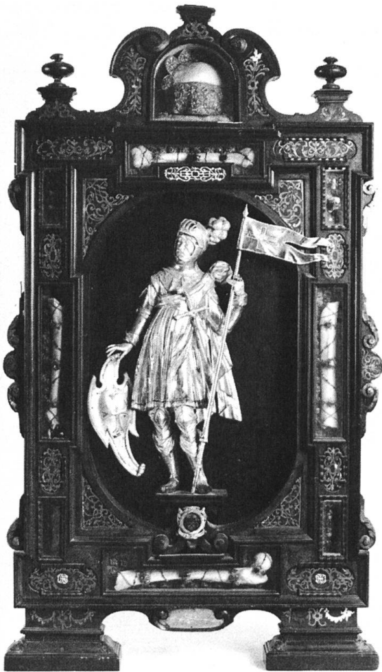
Abb. 6 Hergiswald, Reliquientafel von 1630/31. Im Rahmen Gebeine aus der Gefolgschaft der heiligen Urs und Viktor von Solothurn. Im Zentrum Statuette eines Thebäerheiligen, wohl des hl. Mauritius.

Bau gestiftet hatte. Das Gedicht stammt möglicherweise aus der Feder von P. Ludwig und schlägt in nicht weniger als 44 lateinischen Distychen den Bogen vom Heiligtum in Hergiswald zum französischen Bündnis der Eidgenossen. Das Gedicht macht schlagartig die politische Bedeutung der frommen Stiftung klar. 8 In seinem Werklein Loretokron von 1656 bestätigt P. Ludwig, dass die Loretokapelle in Hergiswald vom französischen König unter dessen Ambassador de la Barde gestiftet, erbauwt und geziert worden sei. 9