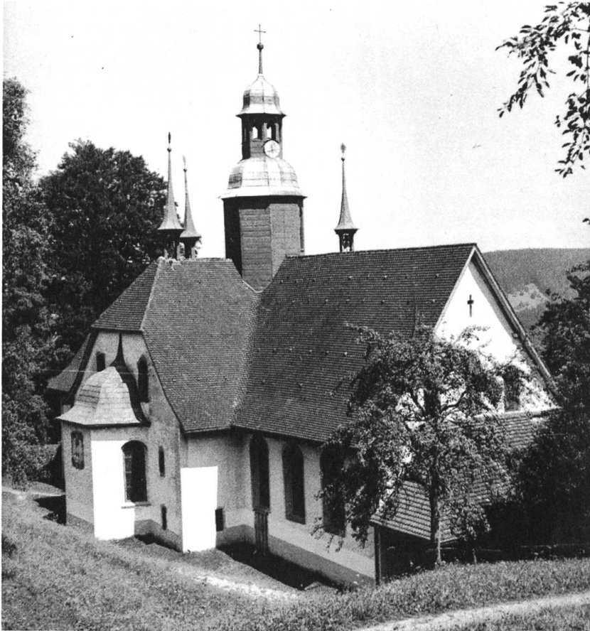
Abb. 1 Marienwallfahrtskirche Hergiswald ob Kriens, Ansicht von Südwesten.

Oberhalb Kriens, etwa auf halbem Weg ins Eigental, steht auf einer steilen Waldlichtung am Abhang des Pilatus die Wallfahrtskirche Hergiswald (Abb. 1). Sie ist der Muttergottes geweiht und weist bei aller äusseren Einfachheit typologische Ähnlichkeiten mit der Basilika des italienischen Wallfahrtsortes Loreto auf. Das langgezogene Kirchenschiff wird in der Mitte von einem Querhaus durchstossen. Am Kreuzungspunkt erhebt sich ein kuppelartiger Dachreiter. Haupt- und Querarme münden in polygonale Chöre unter geschweiften Dächern. Sie gehören zur Sakraments-, Felix- und Antoniuskapelle. Wo man im Innern den Hauptchor erwartet, steht als Kirche in der Kirche eine Loretokapelle. An ihrer Stirne befindet sich unter dem Kuppelreiter der Hochaltar. Die aussergewöhnliche