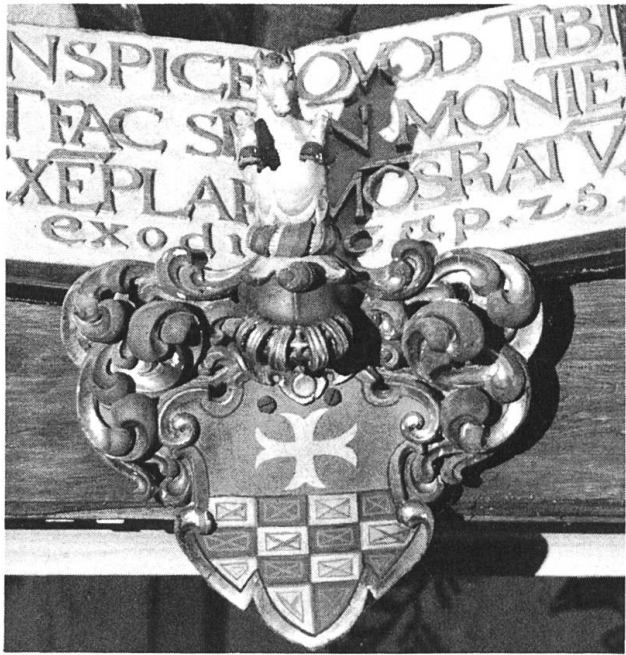
Abb. 7 Hergiswald, Schwallerwappen aus den 1650er Jahren am Triumphbalken.

schwarz gefärbtem Holz fassen. Am 22. Februar 1631 wurde Die Infassung des Thebaischen Heilighumbs dem Rat in Solothurn nebst einer lateinischen Danksagung vorgezeigt. 17 Die kostbare Tafel ist heute auf dem Sakramentsaltar ausgestellt (Abb. 6). Sie ist als Gegenstück zur Rahmung des silbernen Madonnenreliefs von 1627, der Patrona Lucernae, gefertigt und mit Beschlagwerk aus versilbertem Blech verziert. Die Gebeine sind in den Rahmen eingelegt und mit geschliffenen Glas- und wohl auch anderen Steinen geschmückt. Oben verhüllt eine reiche Stickerei die Hauptreliquie, einen Schädel. In der Mitte prangt die 62 cm hohe, holzgeschnitzte und versilberte Figur eines Thebäerheiligen, wohl des hl. Mauritius. Ein emailliertes Wappen und eine Inschrift geben Auskunft über Stiftung und Stifter. 18