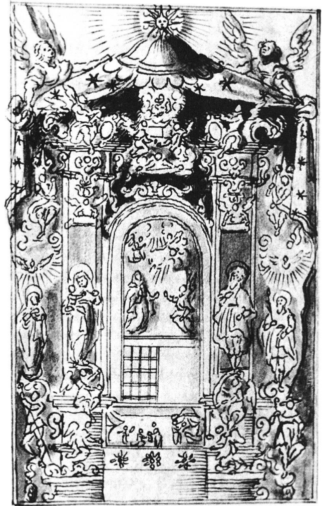
Abb. 4 Hergiswald, Hochaltar der Kirche an der Süd- fassade der Loretokapelle. Altarbild Verkündigung an Maria, Kopie nach dem Segherschen Gemälde in der Kapuzinerkirche Solothurn. Zeitgenössische Tusch- federzeichnung, ev. Entwurf zum Kupferstich von Johann Sigmund Schleenrit von 1652. Staatsarchiv Luzern.

Wirklichkeit. 5 Das Loreten gebeüwlin wurde an die Nordseite der Kapelle von 1620 ange- fügt. 1649 legte man schliesslich in Solothurn den Grundstein für die dortige Loretokapel- le. 6 P. Ludwig verfolgte ihre Vollendung aus nächster Nähe, stand er doch 1650–54 wie- derum dem Solothurner Kloster vor.