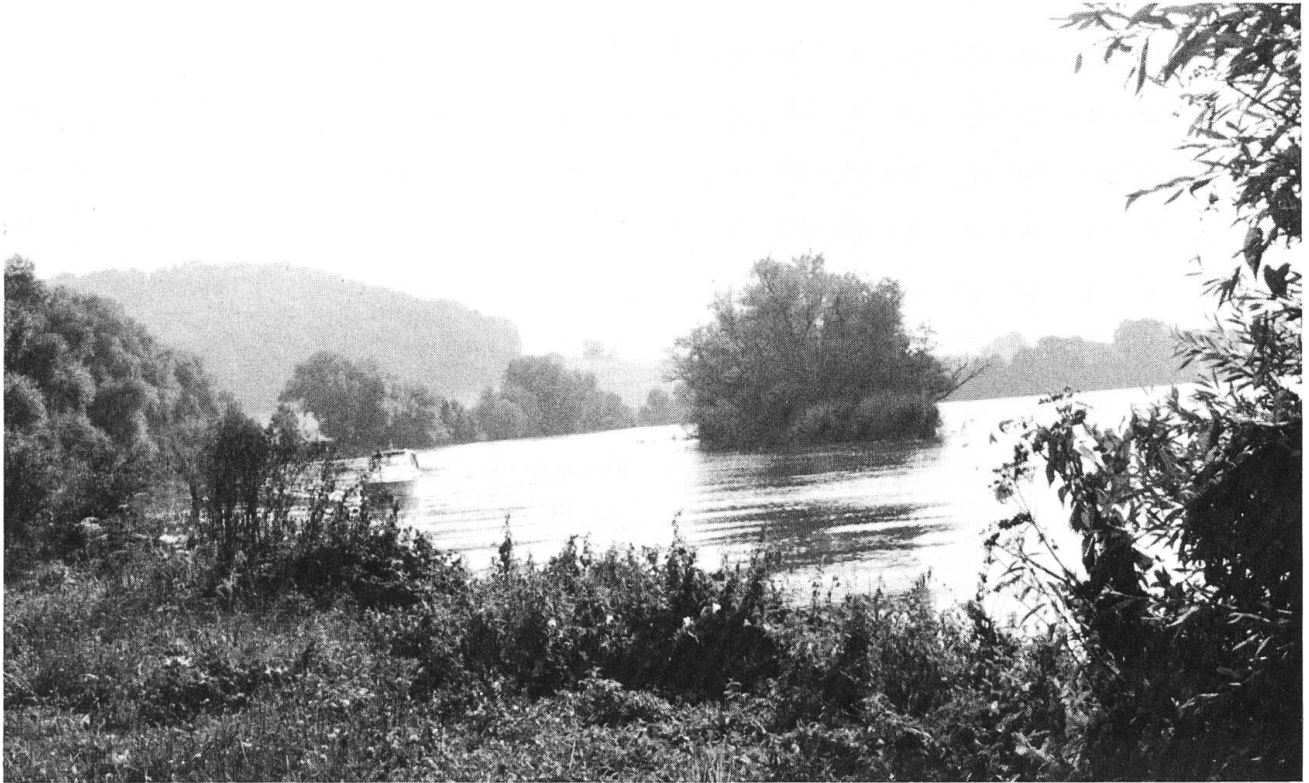
Das kleine Inseli, in eine einmalig schöne Aare-Landschaft eingebettet.