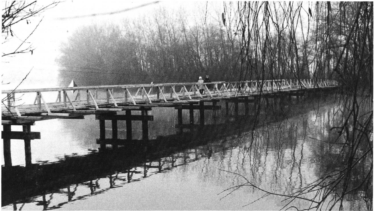
Im Winter 1991/92 wurde auf dem Inseli eine Hofsanierung vorgenommen. Für diesen Umbau hat das Genie Bat 22 innerhalb der Aktion «Gemeinsam» vorübergehend eine Holzbrücke erstellt.