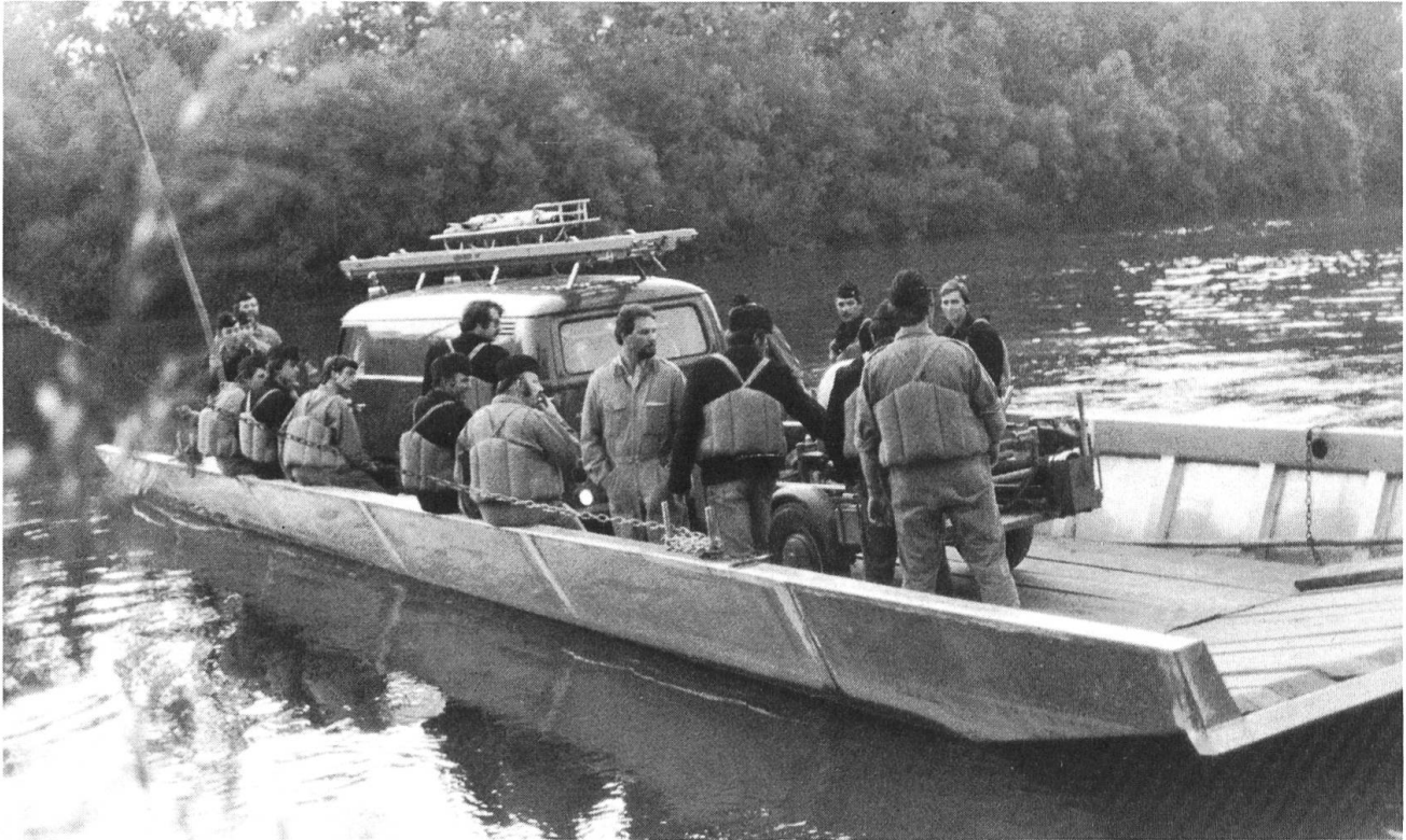
Die Feuerwehr Nennigkofen beim Übersetzen mit dem Pikett-Fahrzeug.

Jetzt betrachte das Spiegelbild im Wasser — dort sind die Details viel besser zu erkennen. An die muss man sich halten.»