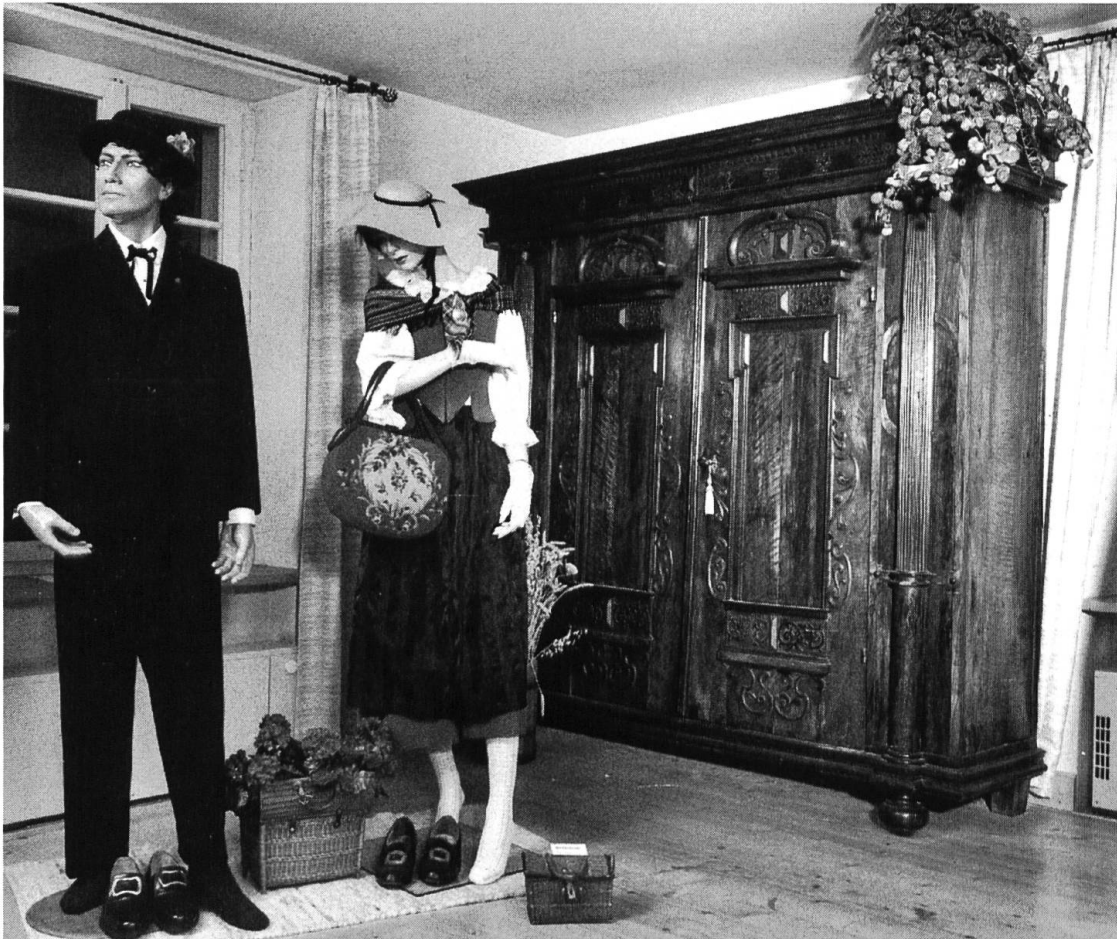
Die Ausstellung «Documenta 700» soll auch das Leben in Laufen in all seinen Dimensionen sichtbar machen. Tracht der Laufner Stadtbürger.

und so wird mit einfachen Mitteln die Sonderausstellung integriert in die Dauerausstellung. Das Museum lässt sich dann betrachten wie ein Bilderbuch: die Dokumente entsprechen dem geschriebenen Text und Kostüme, Werkzeuge und Mobiliar wären die passende Illustration dazu. Dadurch gewinnen beide Bereiche an Anschaulichkeit und Reiz, und die Besucher und Besucherinnen erhalten einen ungleich reichhaltigeren Eindruck von den angeschnittenen Themen.