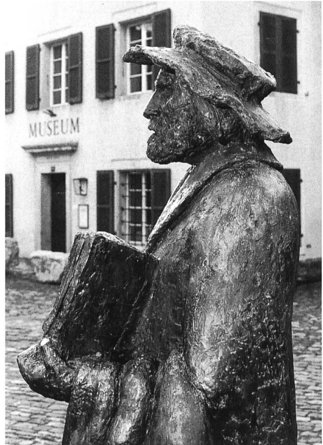
Anlässlich des 700-Jahr-Jubiläums zeigt das Laufentaler Museum Dokumente aus der Geschichte der Stadt Laufen. Dazu zählt auch das Werk des Buchdruckers und Humanisten Helias Helye.

Dementsprechend ist die Ausstellung gegliedert in verschiedene Themenbereiche. Am Anfang steht natürlich der Original-Stadtbrief vom 26.12.1295 (nach alter Zeit-