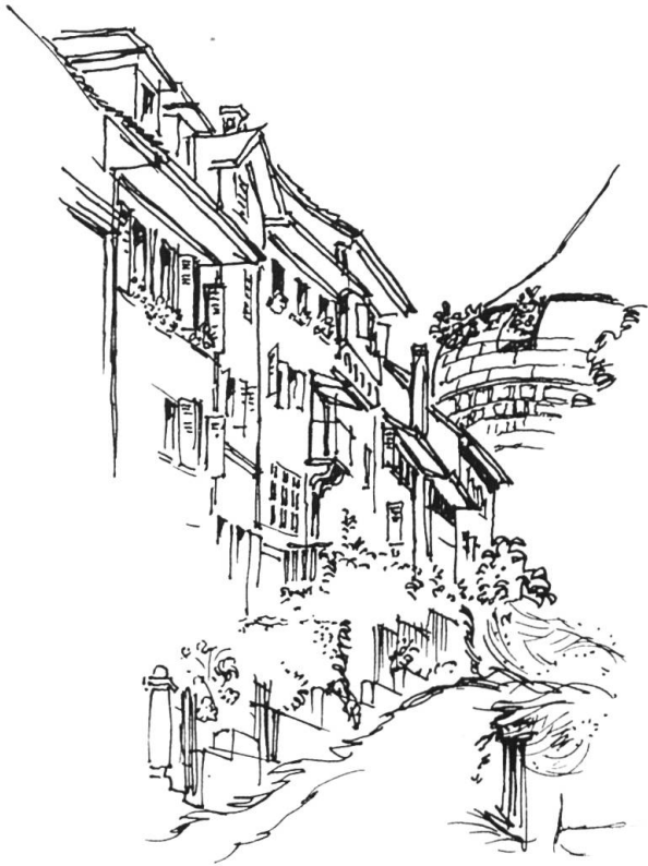
Der Bastionsweg gegen den Riedholzturm in Solothurn, 9. 7. 1983.