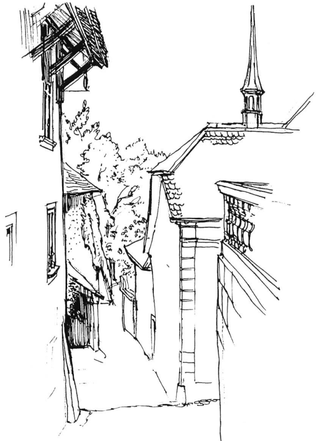
Das Nictumgässlein in Solothurn, 4. 8. 1983.