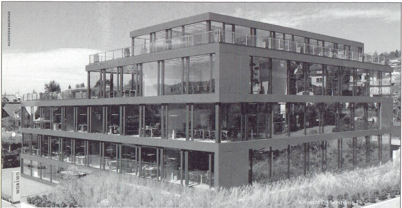
Küsnacht ZH, Seestrasse 59

Abbildung: symbolische Darstellung eines Traudlermännchens (Schokolade)