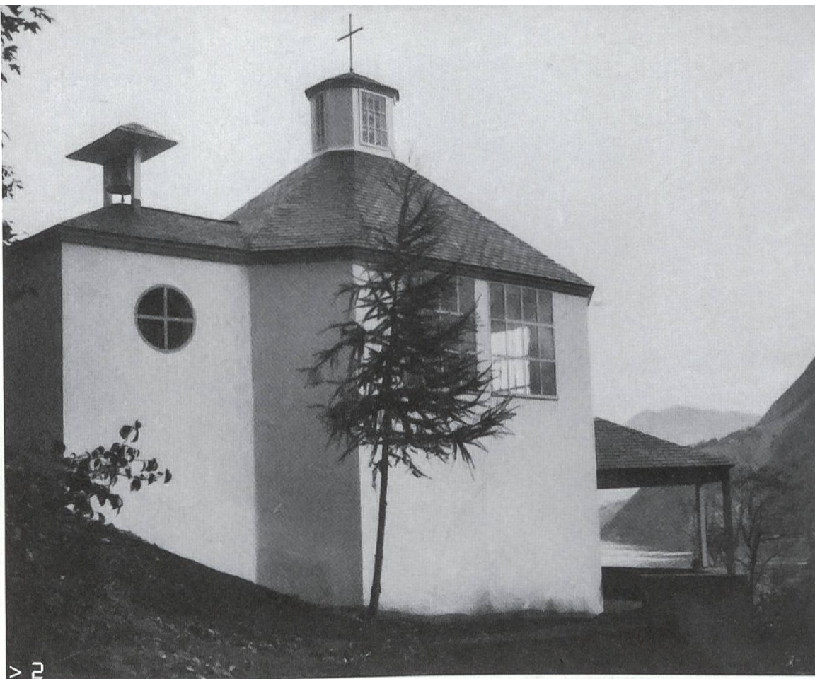
> 1 Otto Schärli, Bergkapelle Fräkmüntegg, 1961, Foto Otto Pfeifer. Aus: Leib-Bewegung-Bau , Schaffhausen 2005.