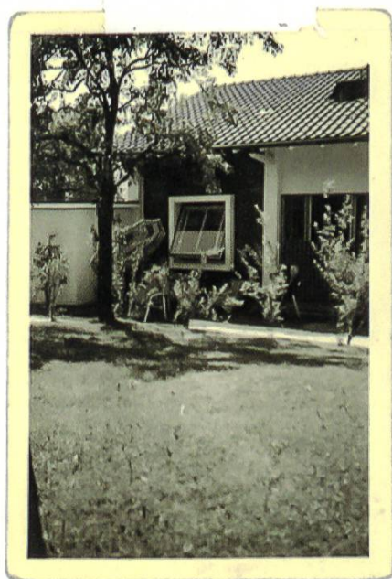
1954 ANSICHT OST