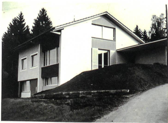
01.11.1953 SÜD-WEST 1 TAG NACH TREIBEN