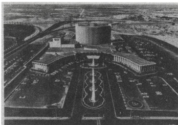
8 «Cesar's Palace» in Las Vegas; aus / d'après «Learning From Las Vegas».

In archithese 16/1975 wird der Bürgenstock mit Las Vegas verglichen.