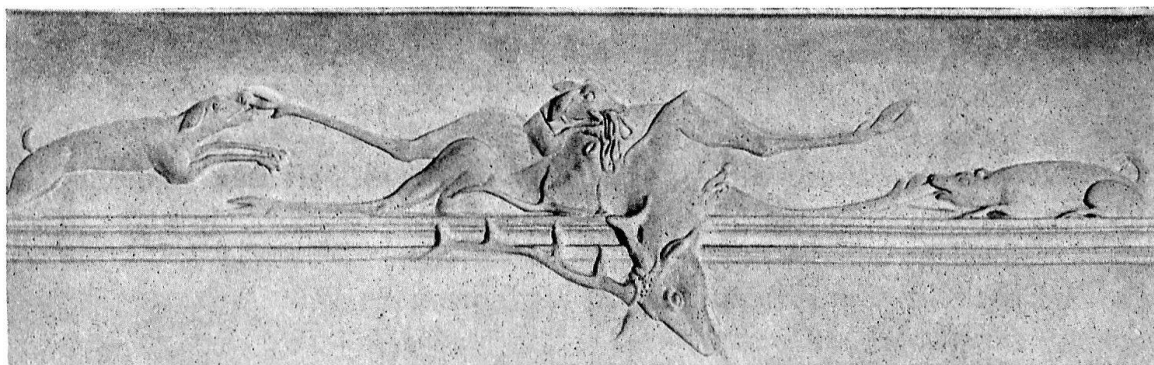
Schaffhausen, Zieglerburg. Jagdszene, Stukkatur. Mitte 18. Jahrhundert.

Nous vous prions de bien vouloir vous inscrire le plus vite possible (dernier délai 25 août 1951) au moyen de la carte ci-jointe et de verser en même temps le montant des frais au compte de chèques postaux n° III 5417 de la «Société d'histoire de l'art en Suisse». Dès réception du paiement, nous enverrons aux participants une carte munie de coupons pour les repas, les courses et le logement pour l'excursion D. Nous vous adresserons en même temps un tirage à part du programme détaillé. Il nous sera impossible de distribuer, comme les années précédentes, les coupons le jour même de l'assemblée générale. Le comité compte sur une nombreuse participation; les parents et amis de nos membres seront aussi les bienvenus.