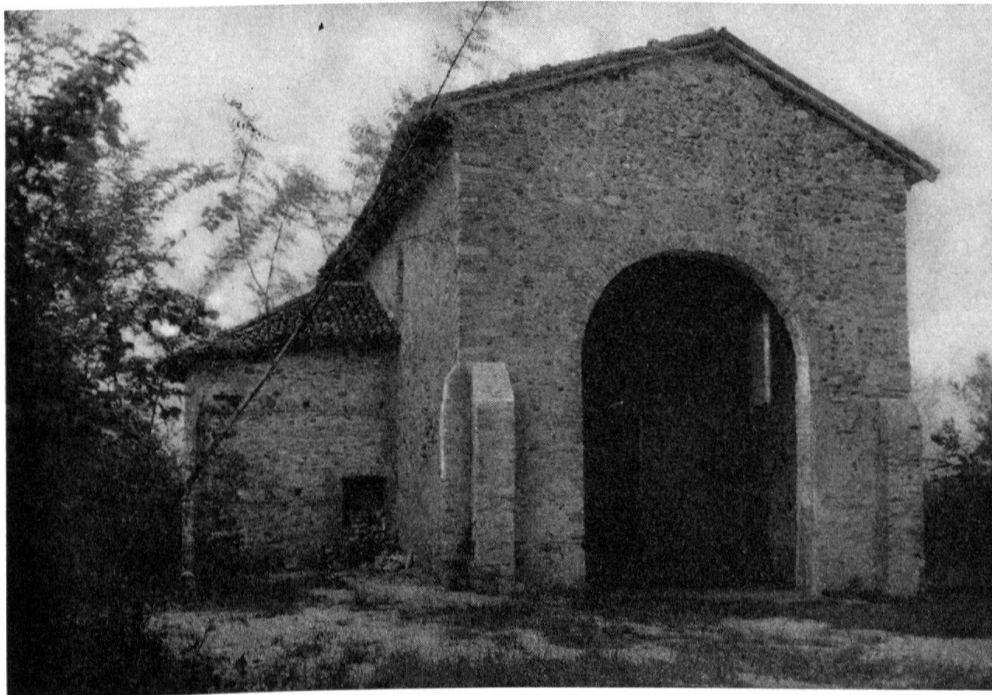
Castel Seprio, église contenant des fresques byzantines