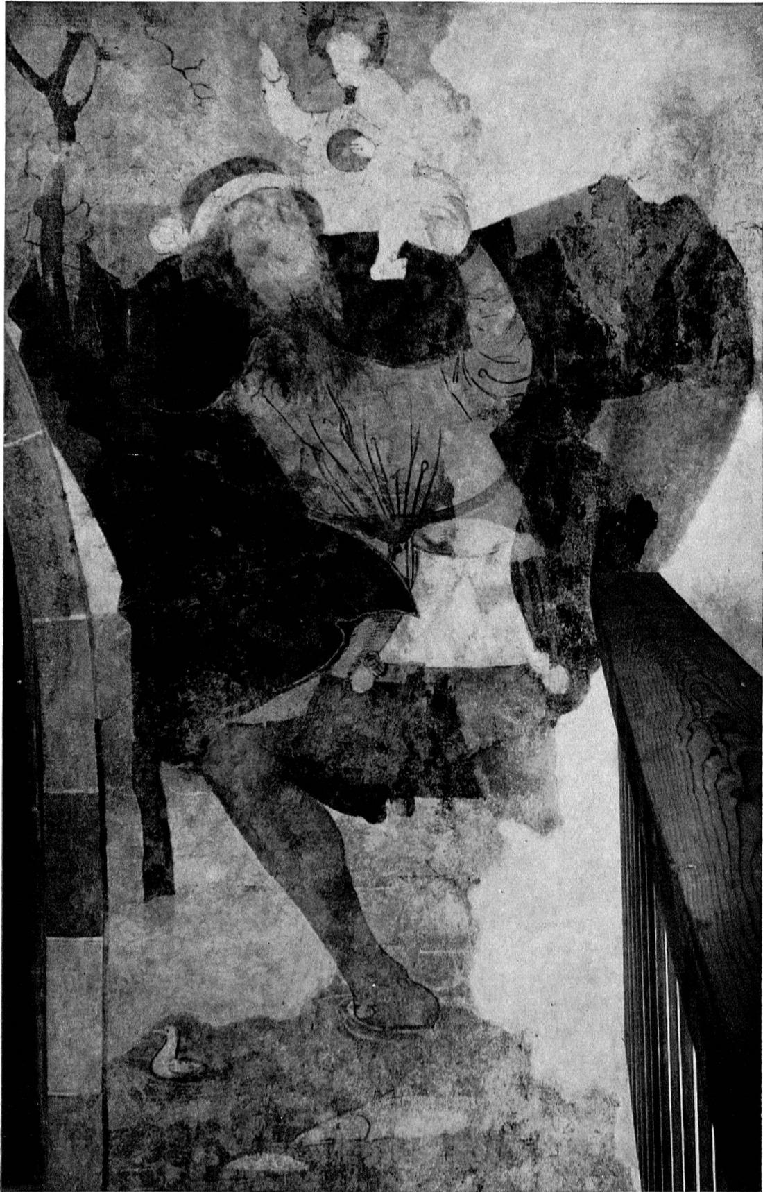
Oberhofen am Thunersee, Schloßkapelle. Hl. Christophorus. Ende 15. Jh.