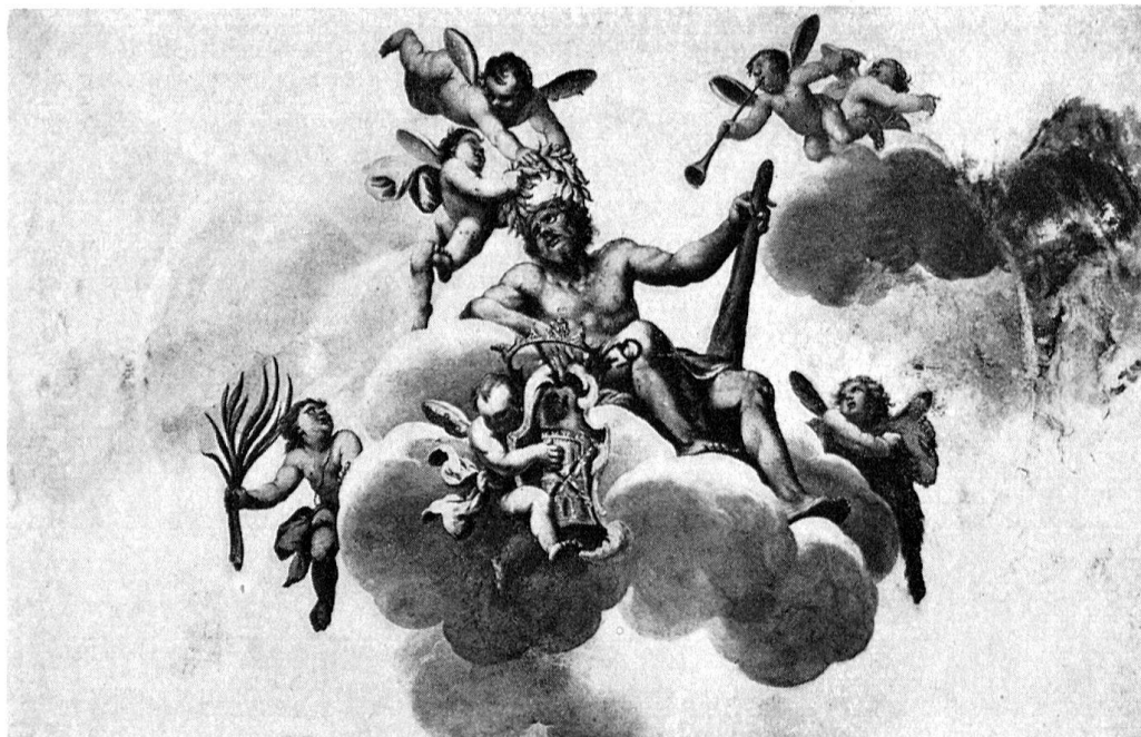
Mendrisio, Palazzo Pollini. Fresques (voir p. 17)