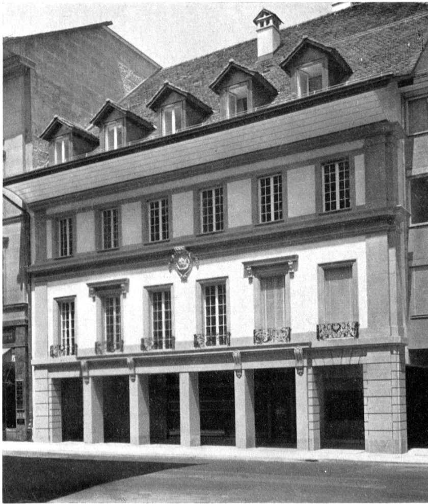
Gleiche Ansicht nach Abschluß des Gesamtumbaus durch die Architekten H. und G. Reinhard, Juni 1958

wieder eingeführt; die Fensterläden, ebenso «heimelige» als provinzielle Zutat des kompositionell völlig unempfindlichen 19. Jhs., wichen Lamellenstoren; Mai 1958 war die Umgestaltung abgeschlossen (Abb. oben). Heute stammen nur noch die guten schmiedeeisernen Fenstergeländer am Hauptgeschoß aus dem 18. Jahrhundert.