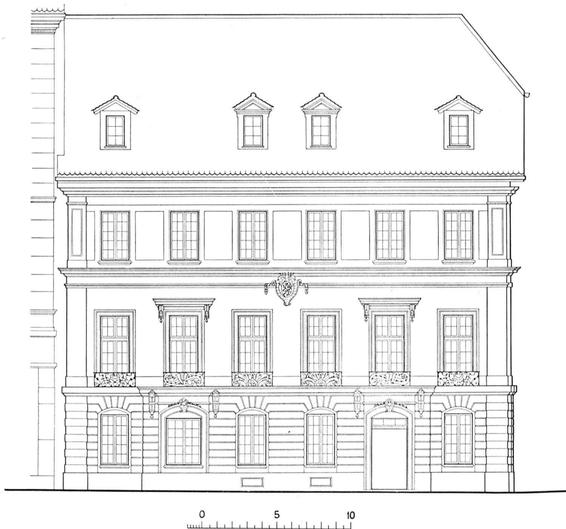
Tscharnerhaus, Fassade im ursprünglichen Zustand Maßstab 1:300