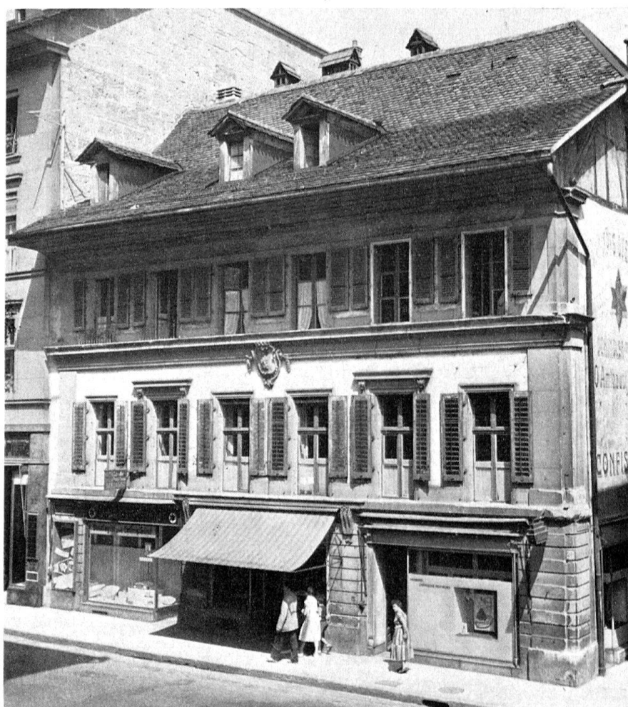
Das Tscharnnerhaus nach der Verunstaltung der Erdgeschoßfront (1905/06). Ansicht von Südosten, unmittelbar vor Beginn der Umgestaltung (1955)

auf Grund des einzigen genaueren Bilddokumentes (Abb. S. 19) fiel außer Betracht; gleichzeitig verlangte die Baubehörde, zur Entlastung des intensiven Fußgängerverkehrs auf dem schmalen Trottoir, den Umbau der ohnehin entwerteten Erdgeschoßfront zur Arkade. In Zusammenarbeit mit dem Schreibenden haben die Architekten, Hans und Gret Reinhard (Bern), nach der ruhigsten Formel der Verbindung klarer Rechteckpfeiler mit dem Mindestmaß gliedernder und bindender Elemente gesucht. Der geistreich verschränkte Rhythmus in der Gliederung des Erdgeschosses – Zusammenfassung der vier mittleren Achsen durch Vorziehen des Gesimses bei Akzentuierung der betonten zweiten und fünften Achse durch Konsolenpaare – wurde wiederhergestellt, die gebänderten Eckpfeiler-Vorlagen belassen (Abb. S. 19 u. 21). Die gesamte Obergeschoßfront sollte nach sorgfältiger Abtragung des Quaderwerks dem Neubau des Innern wieder vorgesetzt werden. Auch hier erwies sich der Erhaltungszustand der Molasse als zu schlecht. Sämtliche Gesimse, Fenstereinfassungen und Bekrönungen einschließlich des Wappenreliefs v. Tscharnner am Kranzgesims mußten ausgewechselt werden. Die ursprüngliche Kleinscheiben-Verglasung, 1955 nur noch an der Hofseite erhalten, wurde an der Hauptfront