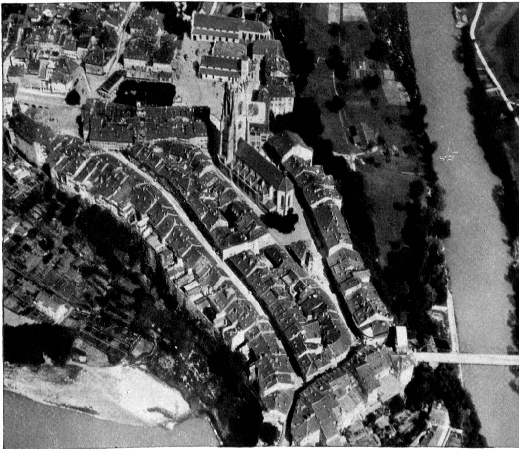
Freiburg i. Ue. Flugansicht von Süden