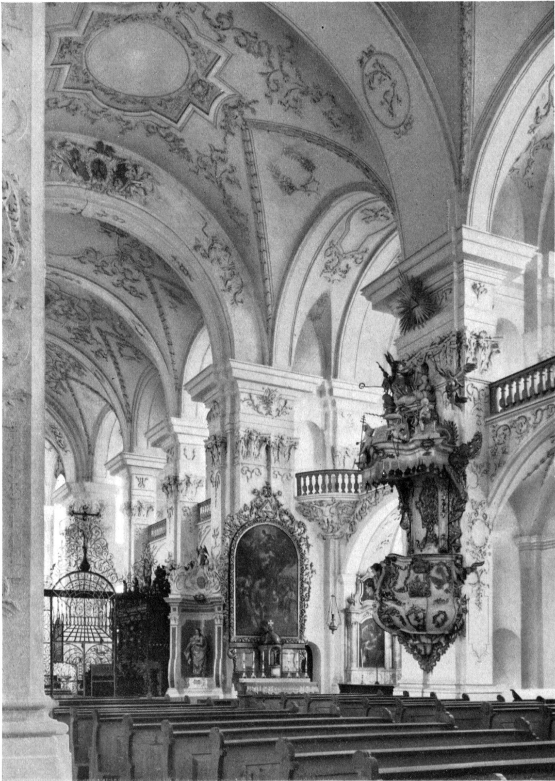
St. Urban, ehemalige Zisterzienserabtei. Inneres der Kirche. Blick gegen den Chor. Vollendet 1715