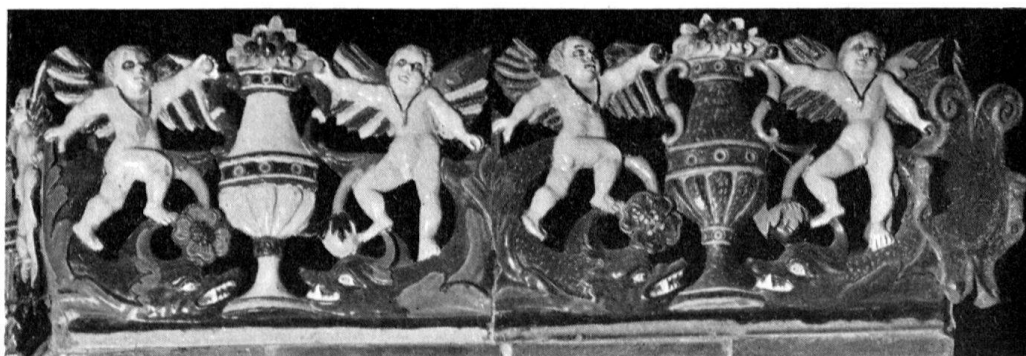
Altishofen, Schloß. Detail vom Ofen des Meisters MK, 1577

Die bürgerliche Architektur von Willisau ist bescheiden, derjenigen von Sempach vergleichbar. Die bäuerliche Bauweise hingegen schafft mit ihren geschnitzten Speichern im Amt Willisau einen Höhepunkt schweizerischer Volkskunst. Reich und vielfältig ist wie fast überall im Kanton die Kirchengestaltung mit Werken der Stukkateure, Freskomaler, Altarbauer, Bildschnitzer, Maler und Goldschmiede, vor allem des 17. und 18. Jhs. Die bedeutendsten profanen Räume besitzen die Schlösser Altishofen und Willisau.