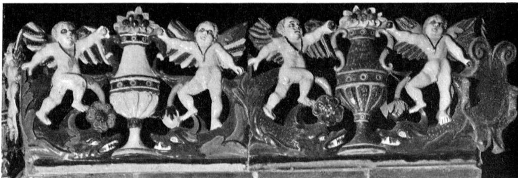
Altishofen, Schloß. Detail vom Ofen des Meisters MK, 1577

Die bürgerliche Architektur von Willisau ist bescheiden, derjenigen von Sempach vergleichbar. Die bäuerliche Bauweise hingegen schafft mit ihren geschnitzten Speichern im Amt Willisau einen Höhepunkt schweizerischer Volkskunst. Reich und vielfältig ist wie fast überall im Kanton die Kirchengestaltung mit Werken der Stukkateure, Freskomaler, Altarbauer, Bildschnitzer, Maler und Goldschmiede, vor allem des 17. und 18. Jhs. Die bedeutendsten profanen Räume besitzen die Schlösser Altishofen und Willisau.