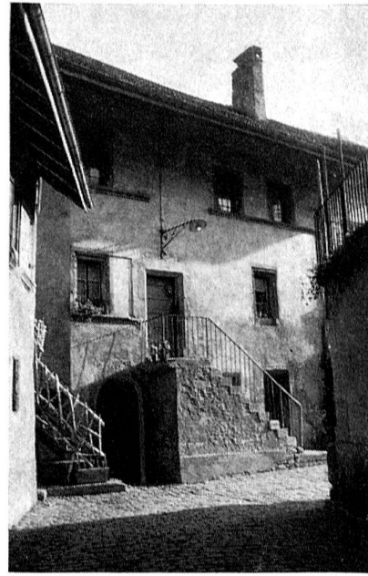
Avenches, maison avec fenêtres du XVI e siècle

ont des fenêtres à meneaux ou des portes voûtées; à la Rue centrale, plusieurs ont des arcades. La ville forme ainsi un ensemble très harmonieux. Autour de la bourgade du moyen âge subsiste l'enceinte romaine, l'une des seules enceintes antiques dont on connaisse le tracé entier, visible encore de nos jours sur presque toute sa longueur, près de six kilomètres. A l'intérieur de cette enceinte, l'on voit quelques ruines romaines: le Théâtre, l'Amphithéâtre, les Thermes, le Cigognier (seule colonne en Suisse restée debout depuis l'antiquité). Avenches est donc une ville pleine d'intérêt et chaque année, des dizaines de milliers de personnes s'y arrêtent pour la visiter.