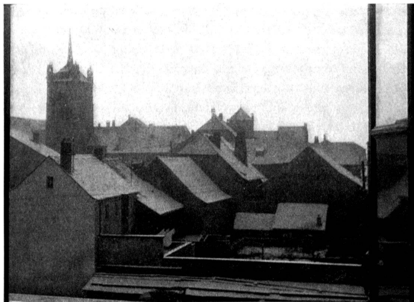
Avenches, vue prise depuis le collège montrant au premier plan cinq bâtiments démolis récemment