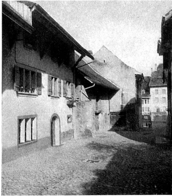
Avenches, rue du Collège, toute la lignée de gauche a été condamnée; actuellement seule la première maison subsiste encore