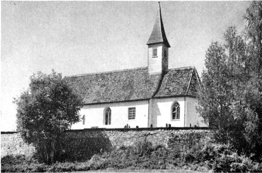
Die wiederhergestellte Pfarrkirche in Hausen bei Ossingen

der Empore eine nicht zu groß dimensionierte Orgel. Über die Erhaltung der sehr altertümlichen und charakteristischen, aber reichlich unbequemen Bänke (im Chor schmale Bänke auf ausgeschnittenen Schwellen, im vorderen Teil des Schiffes niedere Sitzbalken ohne Lehnen) konnte man geteilter Meinung sein; doch ist diese selten mehr anzutreffende Bestuhlung beibehalten worden. (Vgl. KDS Zürich-Land I von Hermann Fietz, S. 214–219 und Abb. S. 223).