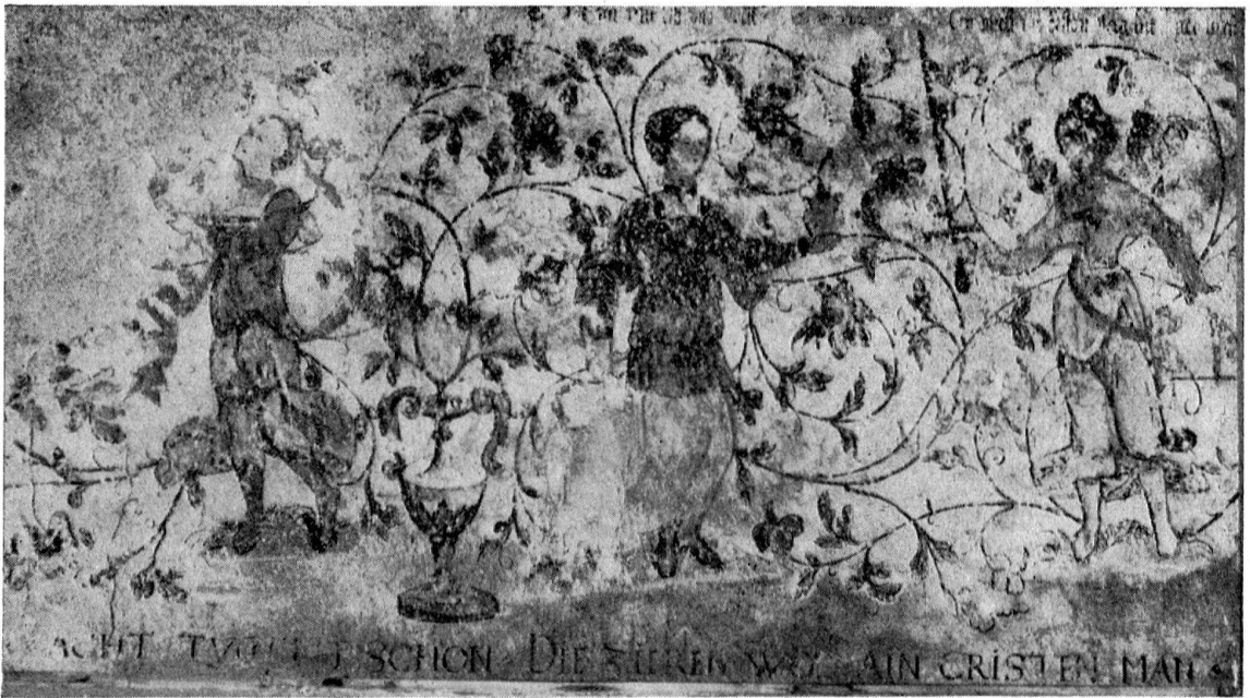
Wandmalereien im Hause Ebnet in Appenzell Spes, Caritas und Justitia