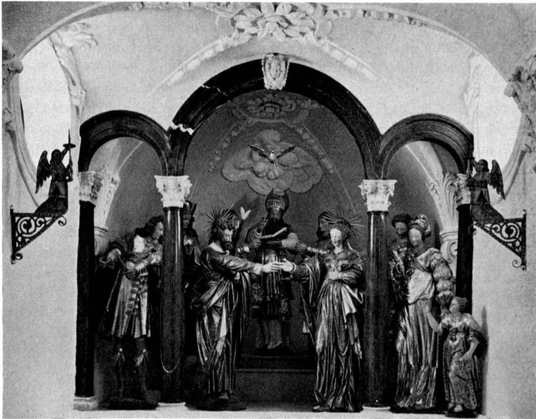
Vermählungsaltar in der südlichen Seitenkapelle von St. Jost zu Blatten