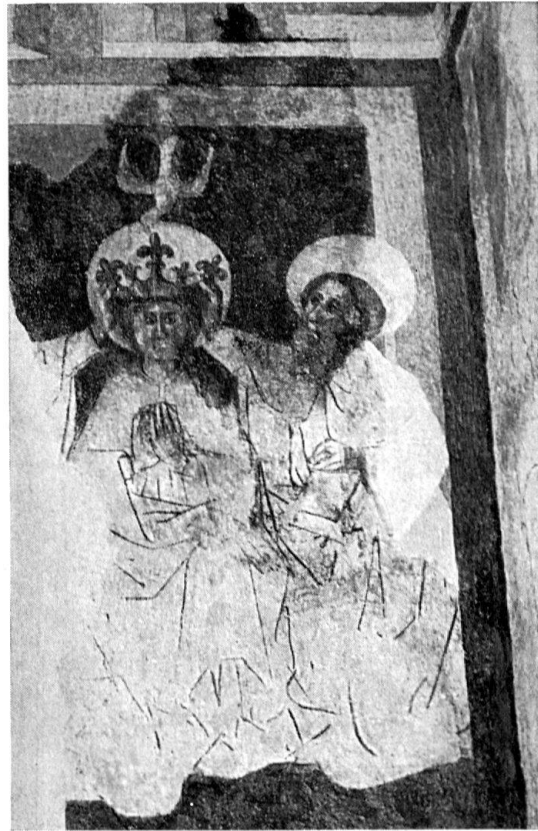
Wurzel Jesse und Krönung Mariae. Wandgemälde an der Chorwand der Pfarrkirche von Kaiseraugst