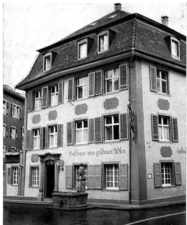
«Goldener Adler» in Rheinfeldern vor und nach der Wiederherstellung