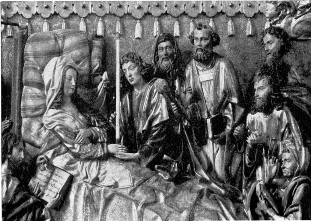
Mariä-End-Altar in der Hofkirche von Luzern. Gotische Relieftafel um 1500

wärts ausgehöhlt ist. Als freies Vorbild hat dem Bildhauer, wie man seit langem bemerkte, ein Stich Martin Schongauers gedient. Graphische Blätter spätmittelalterlicher Künstler wurden ja bekanntlich ganz allgemein als Anregung für Kompositionen von Malern und Bildhauern verwendet. In unserem Falle hat der Bildschnitzer das Hochformat des Stiches in ein Querformat umgesetzt.