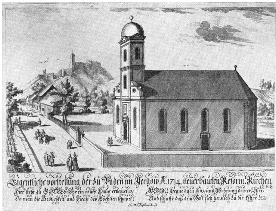
Baden. Reformierte Kirche. Stich von Johann Melchior Füßli (1677–1736)

Mahler» 10 ). Der Stuck und die drei Glocken, gegossen von Johannes Füßli, tragen die Jahrzahl 1717 11 ).