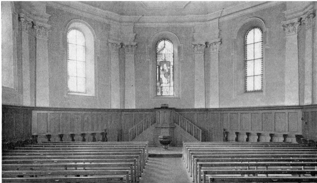
Baden. Reformierte Kirche. Zustand vor 1948

Das herumgezogene Traufgesimse und die gebälkartige Stockgurte markieren die abnehmende Geschoßhöhe; Giebel bereiten den geschwungenen Umriß der Zwiebelhaube vor. Im Innern rahmen durch Gebälkstücke gekuppelte composite Pilasterpaare und das verkröpfte Gesimse die geohrten Rundbogenfenster; einfache Stuckmedaillons besetzen Kehle und Spiegel der Decke. Mit der Pilasterinstrumentierung war in den Jahren 1701/02 die Pfarrkirche im nahen Holderbank vorausgegangen, wo die zusätzliche Aufgabe, als Grabstätte einer vornehmen Familie zu dienen, den Aufwand rechtfertigte.