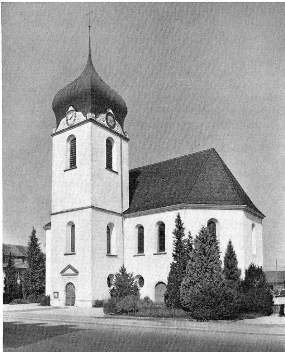
Zurzach. Reformierte Kirche. Außenansicht

Die Nachfolgebauten verpönten die kristallhafte Baukörperform der reformierten Kirche in Zurzach als ein unmodernes Erbstück des nordischen 17. Jhs. Der temple von La Neuveville und die Kirche von Maienfeld, beide vom Anfang der zwanziger Jahre, sind Rechtecksäle. Risalitartige Erweiterungen zu T- und Kreuzformen kennzeichnen die meisten Querkirchen des 18. und 19. Jhs. in der Schweiz; die Trapezform wurde erprobt und Ovale – teils reine Ellipsen, teils aus Quadrat und Zirkelschlägen zusammengesetzt – beliebten häufig als Grundriß. Wenn die Zurzacher Kirche nach jetziger Kenntnis auch nicht mehr am Beginn der Schweizer Querkirchen steht, so ist sie doch die Mutter der