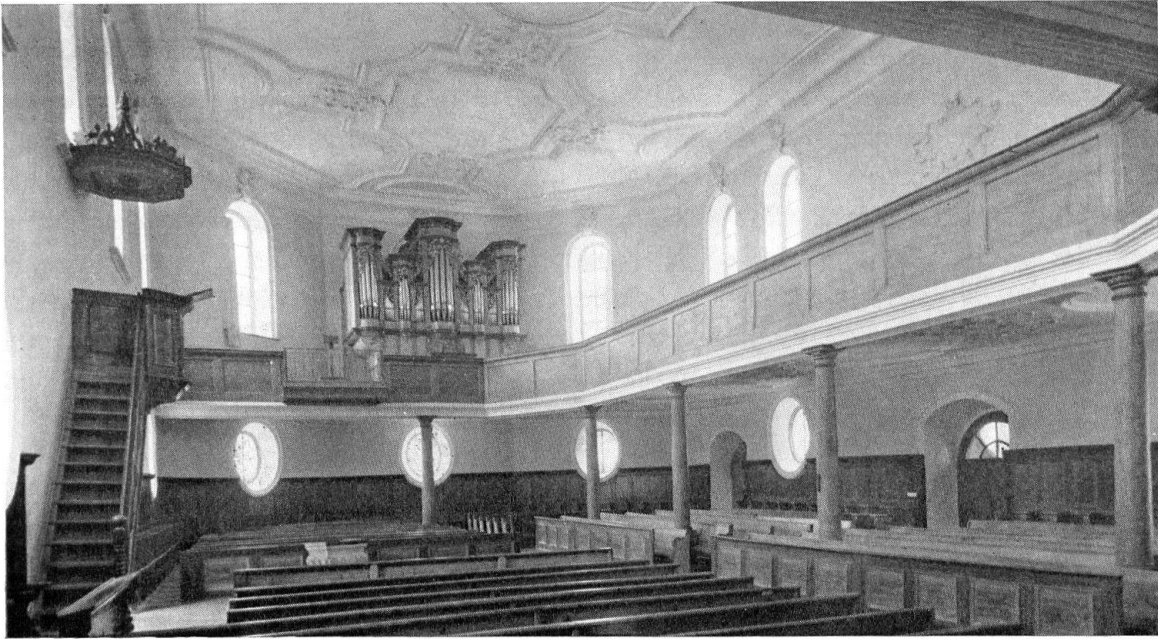
Zurzach. Reformierte Kirche. Zustand 1960

verbunden. Beide Bauteile sind unten von stehenden Ovalfenstern, oben von Rundbogenfenstern durchbrochen. Flache Uhrgiebel mit Volutenzeichnung versuchen der massigen Haubenform standzuhalten. Im Innern ist die einfache Raumform von der Empore überschritten, die auf toskanischen Säulen ruht und auf drei Seiten Kanzel und Taufstein umgibt; dieser dient wie in den meisten nordostschweizerischen Kirchen zugleich als Abendmahlstisch. Der Primat des Außenbaues ist auch deutlich am Deckenspiegel abzulesen, wo die Stuckmedaillons wegen der außen abgemessenen Proportionen überquadratisch sind 17 ).