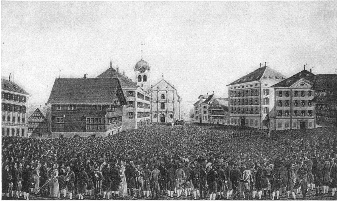
Landsgemeinde von Appenzell A.-Rh. in Trogen, 1814, von J. Jakob Mock, Herisau

Partien aufgeteilt, in eine mittlere, die fast alle Köpfe, zum Teil mit Perücken und Mäschchen, von hinten zeigt, und in zwei seitliche mit den meisten Gesichtern im Profil.