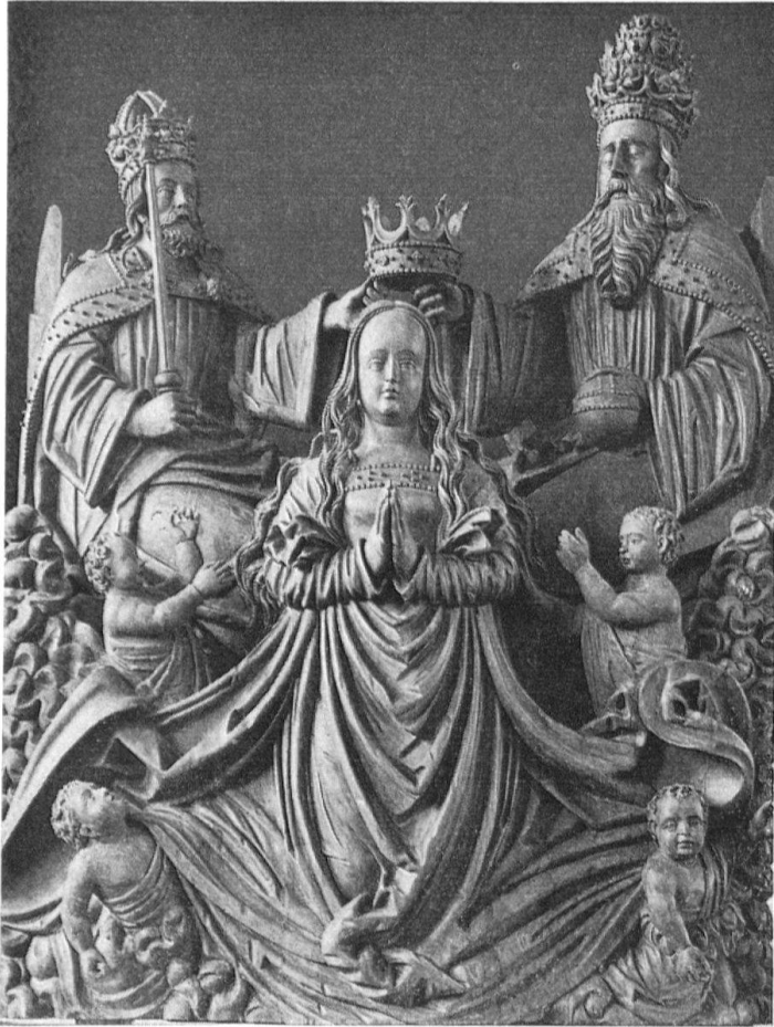
Marienkrönung aus dem Hohenemser Altar

Verboten schon diese äußeren Argumente eine Identifizierung der Plastiken des Hohenemser Altares mit den gräflichen Importen aus Flandern, so wird diese Auffassung durch eine stilkritische Betrachtung noch bestärkt. Es fehlt schlechthin jede Affinität zur zeitgenössischen niederländischen Plastik. Hingegen hat schon JULIUS BAUM 5 die Madonna aus der Mittelgruppe der Marienkrönung mit einer Marienkrönung aus der ehemaligen Sammlung Schnell in Ravensburg verglichen und wies beide einem nicht näher lokalisierten Meister zu. Baums Art der Katalogisierung läßt aber schon die dem Verfasser später brieflich mitgeteilte Vermutung Baums zu, daß er die Hohenemser Maria als nicht zum ursprünglichen Programm des Altares gehörig erkannt hat.