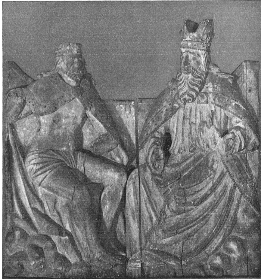
Dreifaltigkeitsrelief. Vorarlberger Landesmuseum Bregenz

Der Vergleich der Hohenemser Maria mit den Plastiken Christi und Gottvaters läßt recht verschiedene Akzente erkennen. Gegenüber dem anmutig frischen Antlitz der Madonna wirken die beiden anderen flach und ausdrucksarm. Die Gewandfalten sind auffallend hart und oberflächlich geschnitten, während die Gewandfalten der Maria in klarem Duktus scharf geschnitten und tiefgratig hervortreten.