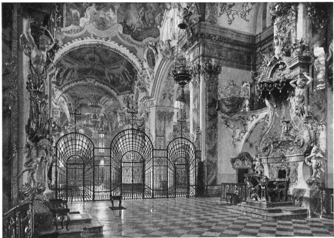
Einsiedeln. Klosterkirche. Inneres, 1719–1726 von Caspar Moosbrugger