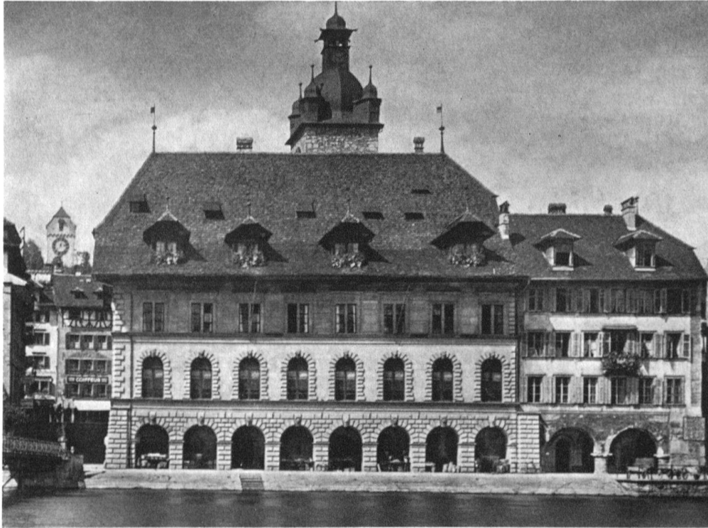
Luzern, Rathaus. Ansicht der Südfassade 1602–1604

«Renaissance» empfundene – Bauart keineswegs ablehnte, sondern sich zu eigen machte. Gradmesser hierfür ist das Luzerner Rathaus. Es war 1600 offenbar für die Luzerner selbstverständlich, Macht und Würde ihres Staatswesens in einem italienischen Renaissancebau darzustellen und hiezu einen Oberitaliener, ANTON ISENMANN aus dem Primmell, und mailändische Werkleute zu berufen. Kein treffenderes Symbol für die innerschweizerische selbstverständliche Verknüpfung von Fremdem und Einheimischem gibt es als das Luzerner Rathaus: von den Arkaden bis zum Kranzgesims stolze italienische Renaissance, aber unter einem hohen Luzerner Bauernhausdach. Zur gleichen Zeit eiferte man aber auch im aristokratischen Wohnbau dem Ritterschen Palast nach, trotzdem dieser nach dem plötzlichen Tod des Bauherrn schließlich Jesuitenkolleg geworden und damit der privaten Sphäre entzogen war. Um 1600 erhielt das gotische Fleckensteinhaus (heute Göldlinhaus) in Luzern einen wenigstens dreiseitigen toskanischen Säulenhof, desgleichen – heute völlig verbaut – das Pfyfferhaus am Mühlenplatz. Das Am Rhynhaus neben dem Rathaus bekam eine italienische Fassade und im Hof als Verbindung von Vorder- und Hinterhaus eine dreigeschossige toskanische Arkadenbrücke.