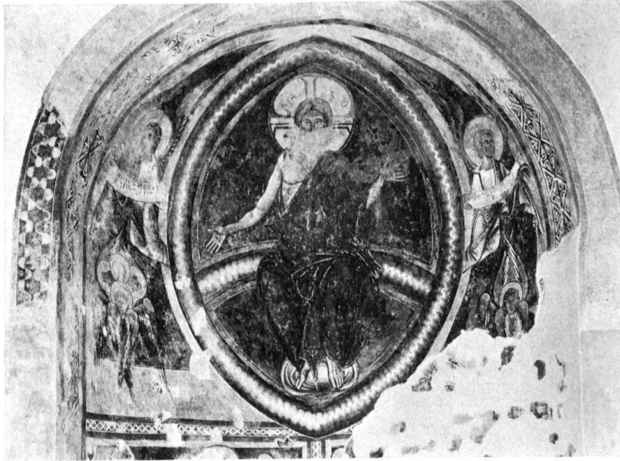
Jüngstes Gericht aus der Nordapsis des Baptisteriums von Riva San Vitale. 11. Jh.