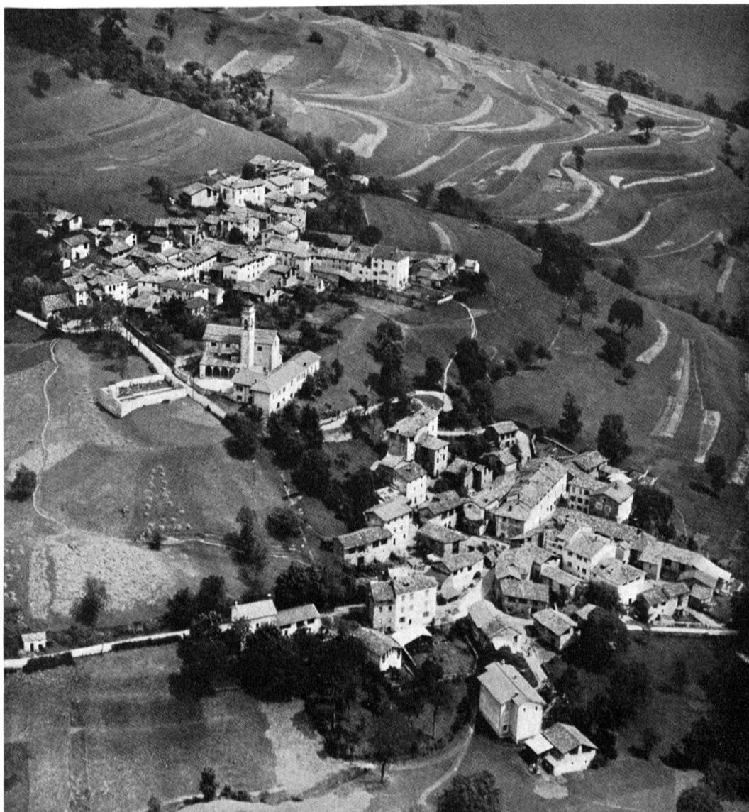
Flugansicht von Arosio, der höchstgelegenen Siedlung des Malcantone