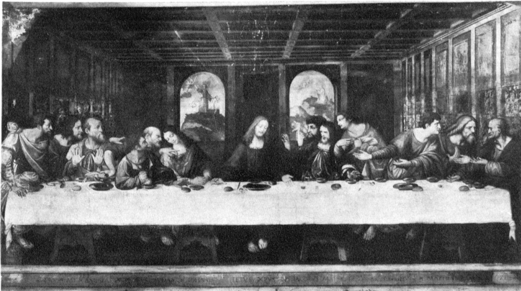
Abendmahl (Wandmalerei) in der Kirche S. Ambrogio von Ponte Capriasca (Kopie nach Leonardo da Vinci). Vor 1567