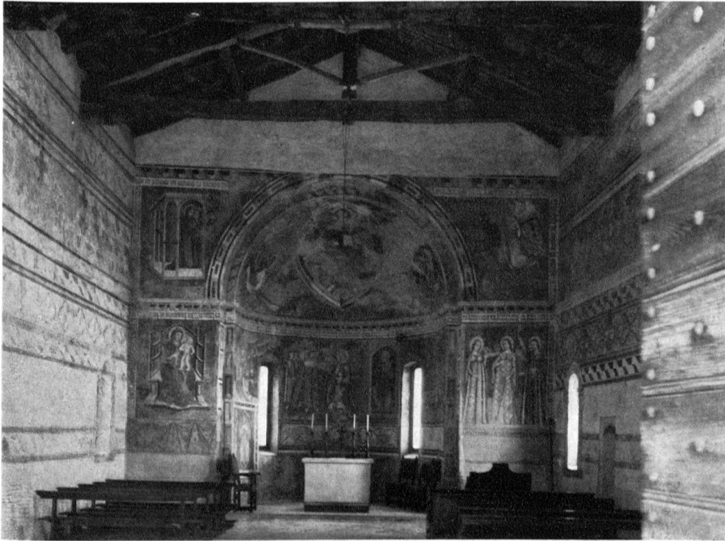
Inneres der Kirche S. Pietro bei Castel San Pietro