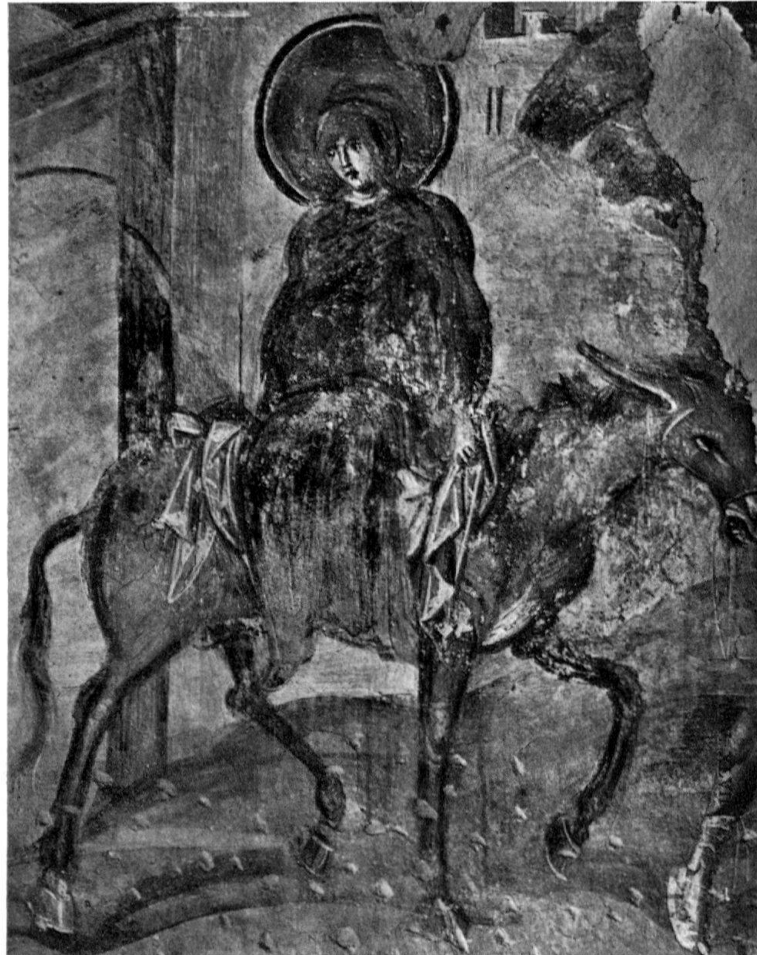
Castelseprio (Italien): Wandgemälde in der Kirche S. Maria Foris Portas

RIVA SAN VITALE: Kirche S. Vitale, Kirche Santa Croce, siehe Seite 11.