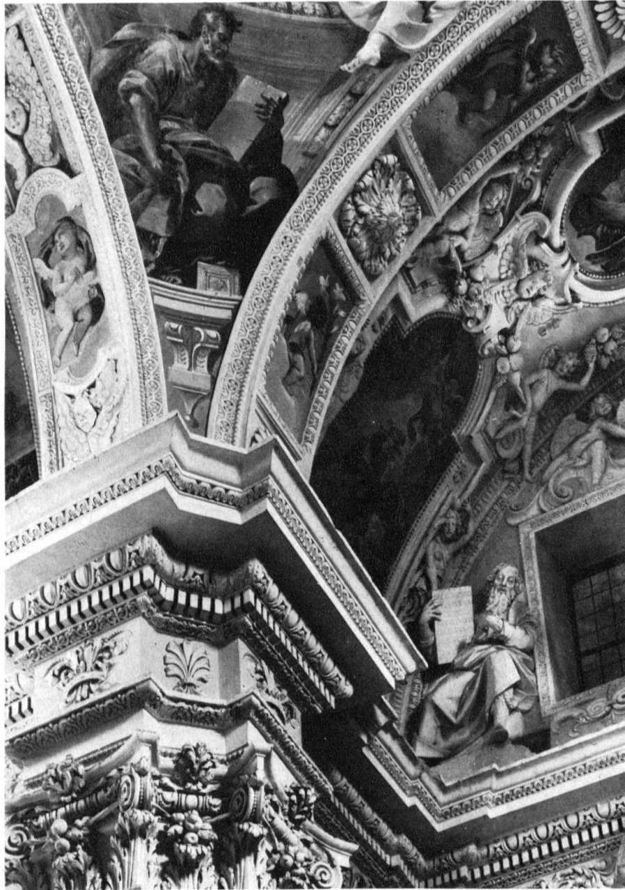
Carona: Detail der barocken Ausstattung in der Kirche S. Giorgio, Ende 16. Jh.