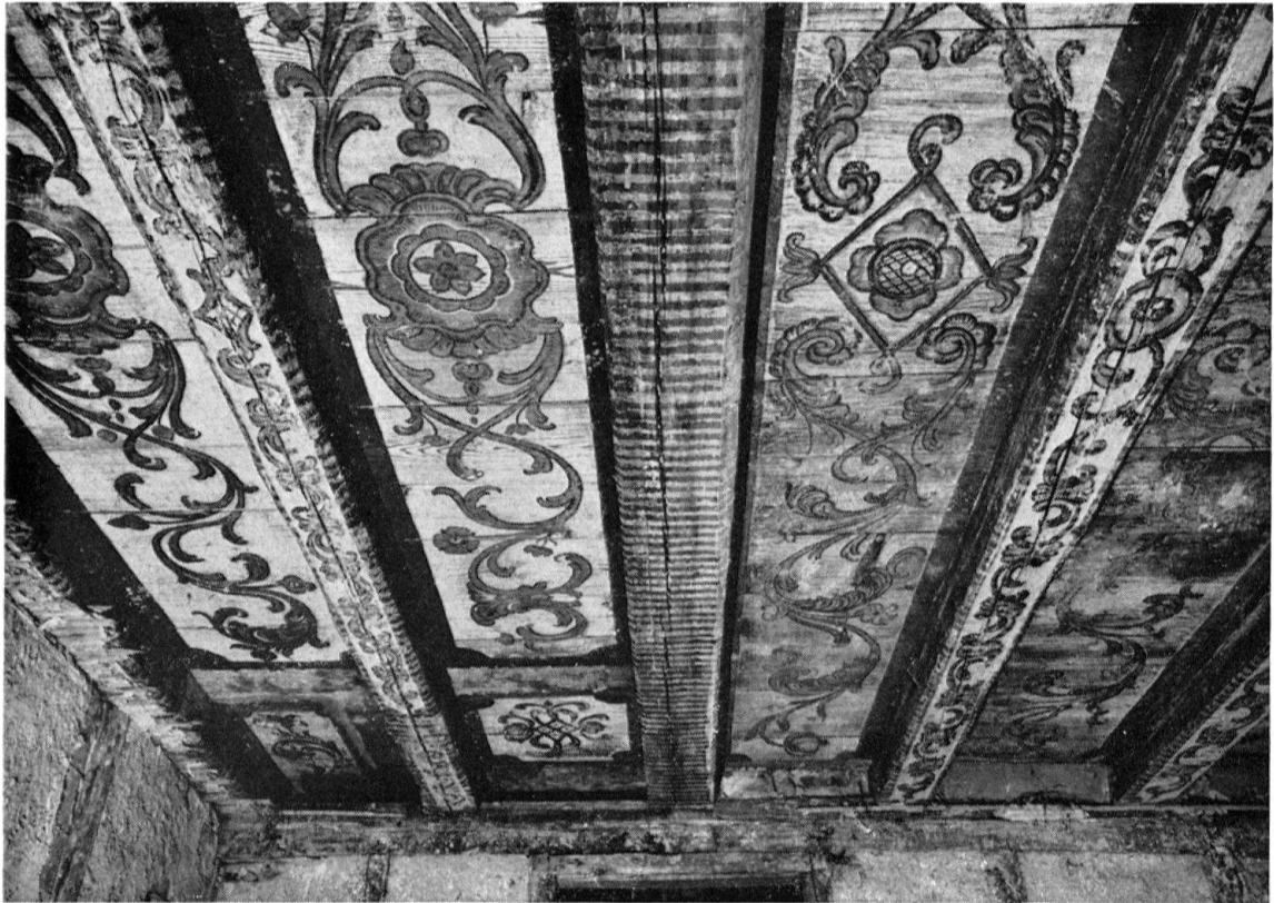
Zollikon, Haus zur «Tiefenau». Bemalte Balkendecke vor der Restaurierung