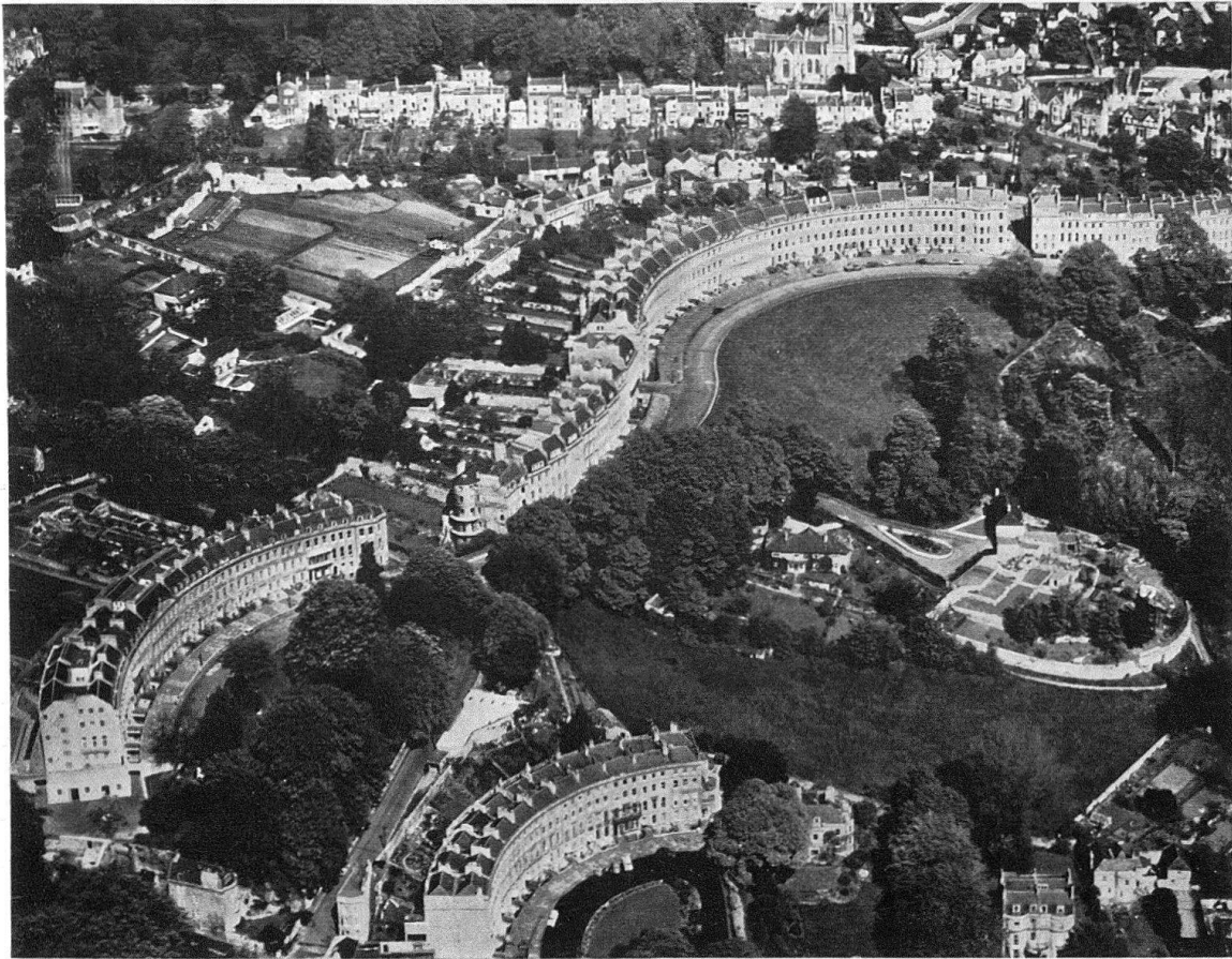
Bath, ville haute. Vue aérienne des «crescents» (Landown Crescent)

fournissent des occasions d'étudier attentivement cette question et de réaliser des ensembles dans lesquels on a cherché à rétablir le caractère donné par des anciennes estampes des villes dans lesquelles l'opposition entre la dominante de l'édifice principal avec ses tours et les maisons basses qui l'environnent constitue une des caractéristiques du paysage urbain.