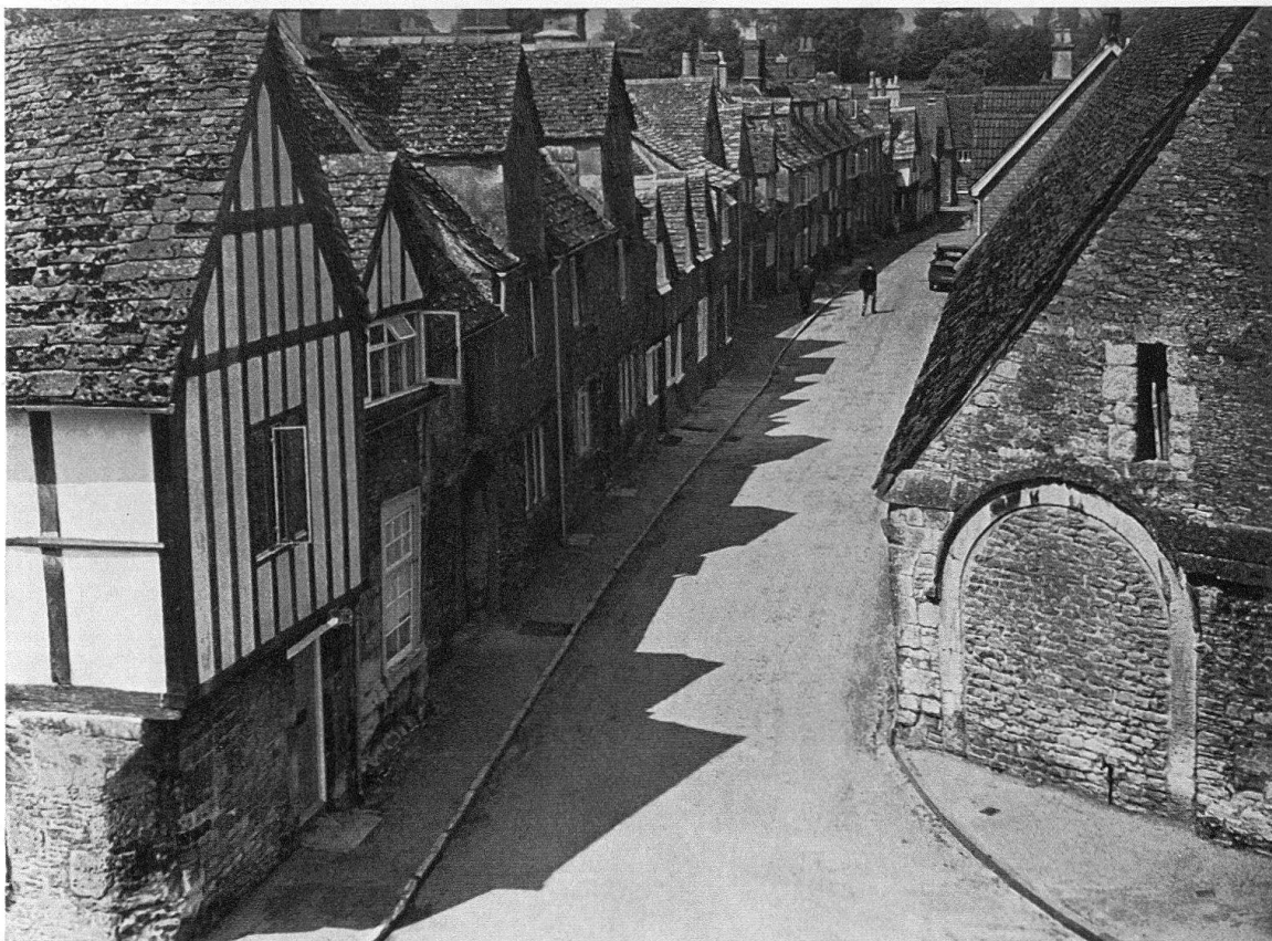
Lacok (Somerset). Une rue du village, propriété du National Trust