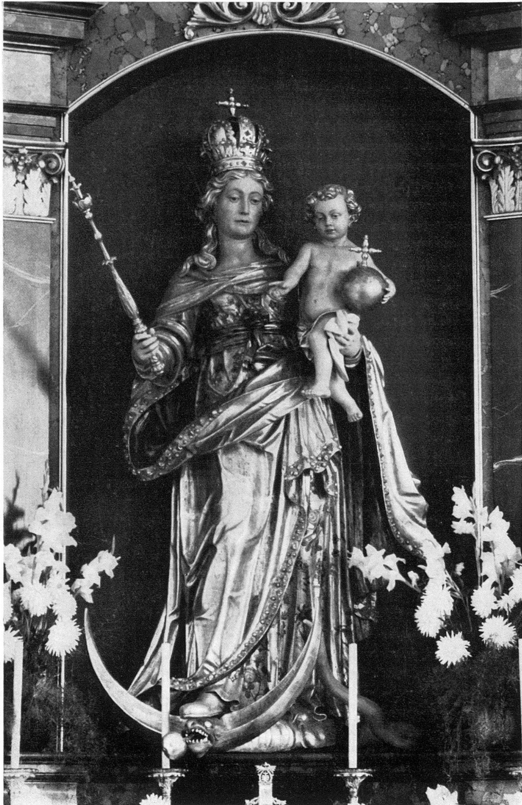
Mörschwil, Pfarrkirche Madonna