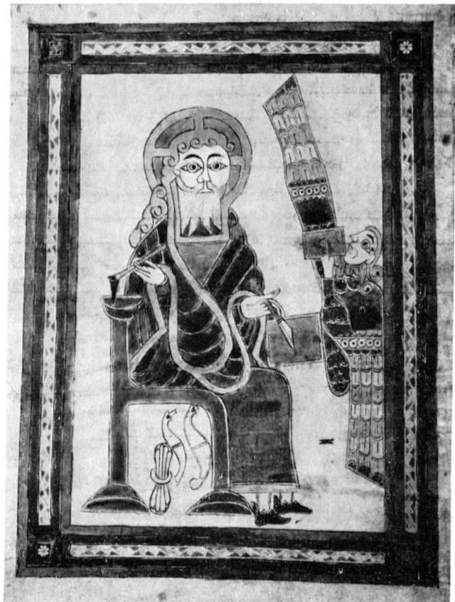
Der Evangelist Matthäus als Buchschreiber. Irisches Fragment um 800

Es wäre nun eine eigene und weite Aufgabe, jene Mönche zu nennen und zu preisen, die in St. Gallen vom 9. bis zum 11. Jh. gedichtet und komponiert haben und deren Sequenzen und Hymnen, Tropen und Antiphonen in den großartig gemalten Liturgiebüchern – beispielsweise der Gottschalk-Gruppe 29 unter dem Reform-Abt Nortpert um 1050 – gesammelt worden sind. Unsere Quellen sind an solchen Künstlernamen nicht verlegen: Iso und Marcellus, Ratpert und Tutilo, Hartmann und Waltram, Notker der Stammler und Notker der Arzt; dann die drei Ekkeharte: der Dekan, der Höfling und der Chronist; schließlich Hartker und Luither, dazu ihre Schüler und Nachahmer. «Wer zählt die Völker, nennt die Namen, die gastlich hier zusammenkamen?» – Dieses Lokale und Nominale hat für seine Zeit dadurch