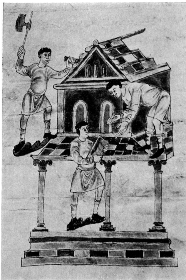
Der Bau des Tempels. Miniatur im Goldenen Psalter 2. Hälfte des 9. Jhs.

Der nächste Bauherr war Abt-Bischof Salomon (890–920). Ekkehart ist voll des Lobes, wenn er vom Bau der kreuzförmigen St. Magnus-Kirche (Kap. 4) und in anschaulichen Einzelheiten von der Bereicherung der Münster-Sakristei mit erlesensten Stücken aus Gold und Silber, aus Elfenbein und Edelstein berichten darf: «libros, vasas, vestes varias» habe er seinem Gallus-Kloster großzügig verschafft, also Bücher, Gefäße und Paramente (Kap. 24). Wie man zu seiner Zeit gebaut hat, mag die gleichaltrige Prachthandschrift unseres Goldenen Psalters (Cod. 22) andeuten – beispielsweise durch die Miniatur vom Tempelbau Davids mit den fränkisch gekleideten Werkleuten, wiewohl selbstverständlich spätantike und byzantinische Bildvorlagen stärker einwirkten als die reale Gegenwart. – Das 10. Jh. stellte so-