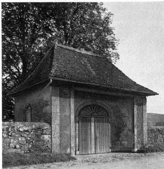
Cornaux. Le porche du cimetière (1812)