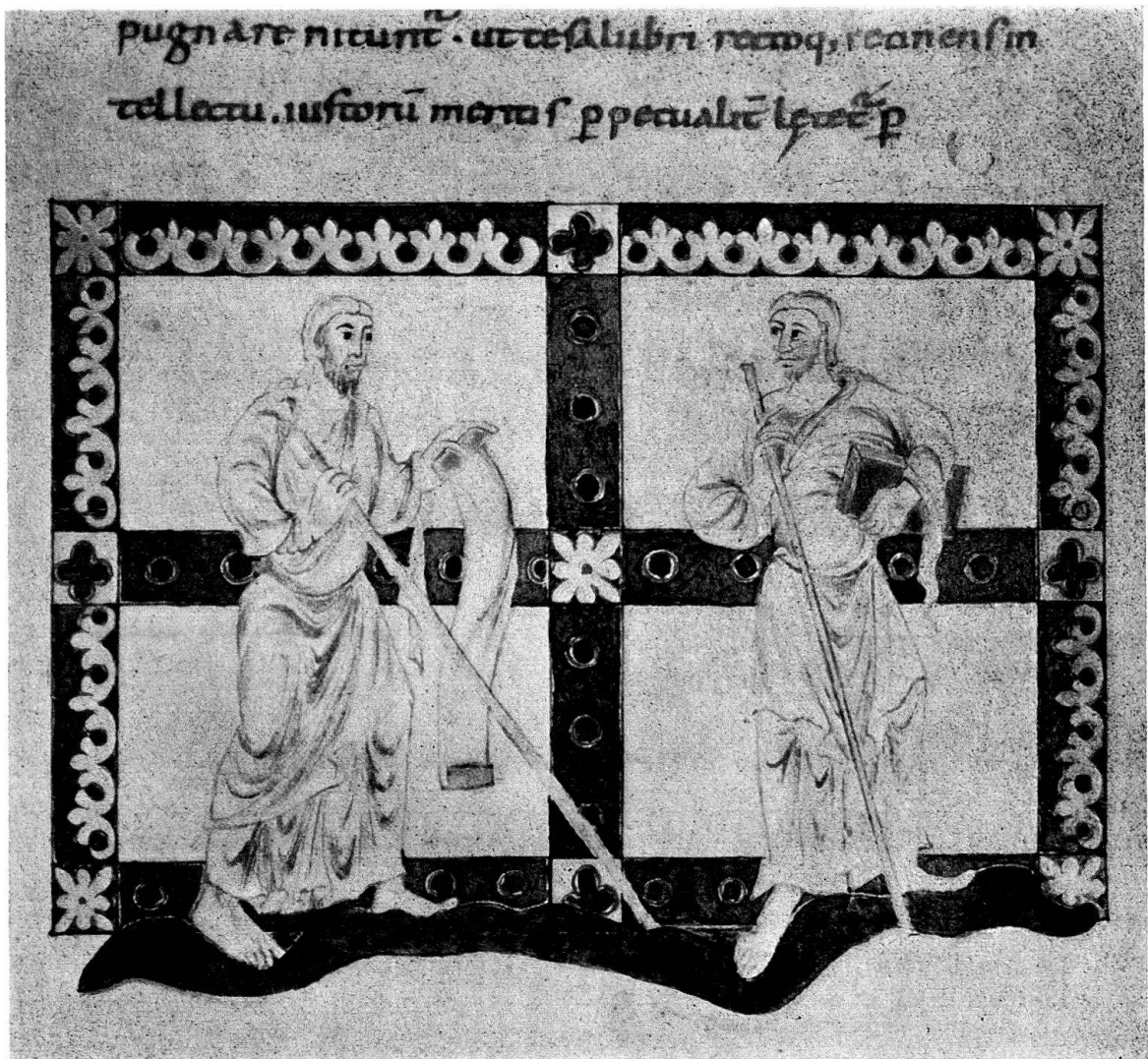
Abb. 1. Goldener Psalter der Stiftsbibliothek St. Gallen (Cod. 22, S. 150): Zwei Propheten

Ehe wir uns dessen genauerer Analyse zuwenden, sei auf die besondere künstlerische Qualität der Figuren hingewiesen. Von allen figürlichen Darstellungen des Psalterium Aureum sind sie in Proportion, Haltung und Bewegung die souveränsten. In der freien Art und Ponderation, wie sie auf dem wellenförmigen Stück Erdreich stehen, in der spannungsvollen, aber keineswegs abrupten Drehung der Körper, in deren Drapierung, in der Beziehung beider Figuren zueinander werden geradezu antikische, klassische Elemente sichtbar. Am nächsten liegt stilistisch die Gestalt Samuels in der Miniatur der Salbung Davids. Man fühlt sich über die Malerei hinaus an Bildwerke erinnert, an die Prophetengestalten romanischer Skulpturenzyklen, aber auch – und sicher mit noch besseren Gründen – an die karolingische Bildhauerei, die kleine der Elfenbeintafeln und die Großplastik in Stuck. Da die beiden Prophetengestalten der St.-Galler Miniatur im Prinzip hell leuchtend, nur farblich laviert erscheinen, gemahnen sie ganz besonders an transparent und nur teilweise gefaßte Stuckplastiken (vgl. solche Werke in Disentis, Münstair, Mals und Cividale).