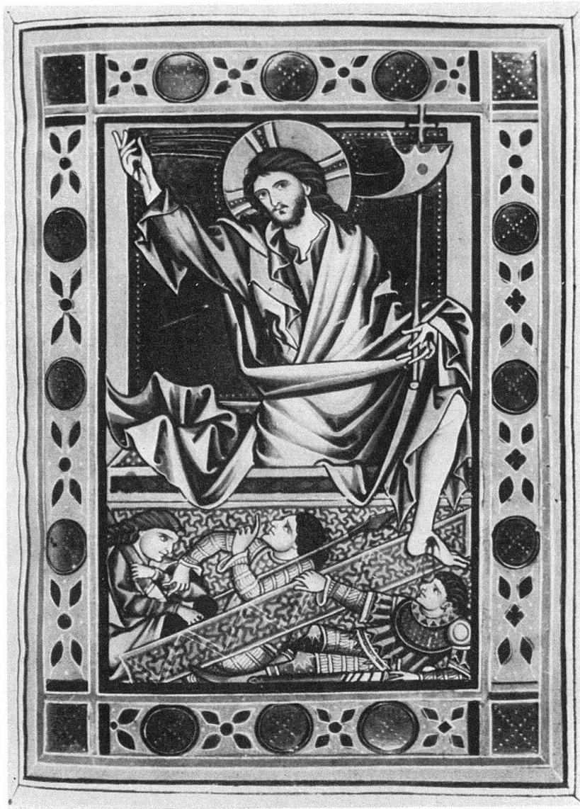
Abb. 3. Zentralbibliothek Zürich, Psalter Rh. 167: Auferstehung Christi

Die empfindsamen oder leidenschaftlich-sachlichen Lösungen des ersten Drittels des 13. Jhs. lassen in eigentümlicher Weise den Gehalt über die große Form triumphieren. Mit dem Katharinentaler Kreuz schlägt das Pendel zu einem Ausgleich, mehr noch: zu einer Verquickung von Form und Gehalt zurück, die in ihrer Dichte der Formulierung des Themas auf dem Tragaltar von Stavelot den Anschein eines Zufallstreffers verleiht. Als Hauptform arbeitet der Maler nun entschieden den von Kopf zu Knien geschlagenen Bogen heraus. Er opfert der Konstanz der Biegung nahezu alle Umrißdetails und streicht die Binnenzeichnung des geglätteten Leibes in strenger Analogie zum Lententuch auf einige wenige Querakzente zusammen, die vornehmlich die Kadenz der Krümmung beschleunigen und die Leibesrundung einkreisen. Er streckt den Oberkörper über die Massen, weniger organischer Spannung, als der Kurve zuliebe, die sich in der Höhlung des Bogens vom schwärzlichen Blau des Glasflusses in der Mitte des Kreuzstammes ab-