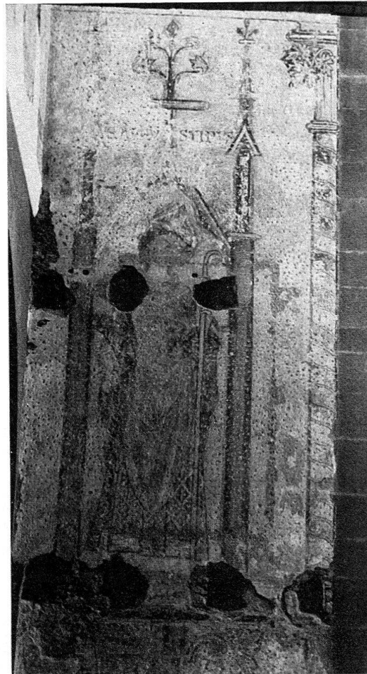
Abb. 2. Konstanz. Insel-Hotel, ehemalige Dominikanerkirche. Südflügel

Die ebenfalls großfigurig bemalte Triumphbogenwand 7 , von der nur rotgrundige Blattrankenansätze in den Zwickeln erhalten sind, muß bis zu ihrer Zerstörung vor 1875 ein großartiges Gegenüber zur Westwand gewesen sein. Wenn in der Konstanzer Dominikanerkirche wie üblich die Ausmalung im Chor und an der Triumphbogenwand begonnen hat, wird die Westwandbemalung zuletzt entstanden sein. Diese über 12 m hohe bemalte Fläche ist nur schlecht im Ganzen zu photographieren, weil die eingezogenen Hotelstockwerke bereits am zweiten Obergadenjoch von Westen beginnen, während der Beschauer die ganze Wand unverkürzt mit dem Auge erfaßt. Es sei hier das Verständnis des Eigentümers Baden-Württemberg – Land- und der Hotelgesellschaft hervorgehoben, die das Vestibül, das heißt die vier westlichen Joche, nur durch eine Glaswand vom Saal trennen wollen, so daß das 40 m lange Mittelschiff weiterhin im Ganzen gesehen werden kann. Die Westwand wird dadurch auch künftig in größerem Abstand zu sehen und für den Saal in ihrer wohl abgewogenen Farbigkeit ein Schmuck sein.