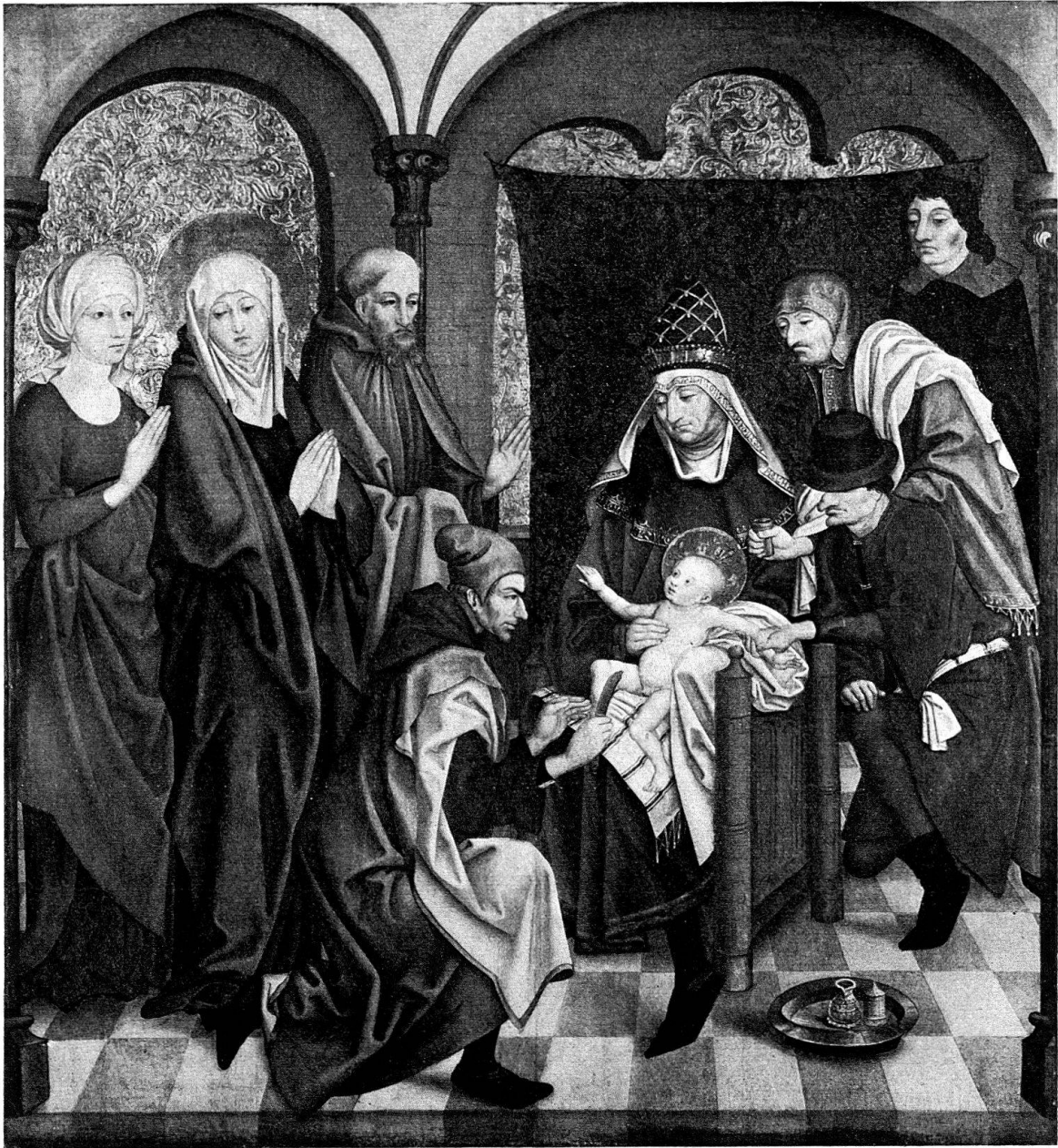
Abb. 1. Beschneidung Christi, Holz, 136,5 × 124 cm, Staatsgalerie Stuttgart

rienleben, was durch das Auftauchen der Beschneidung als eine der sieben Schmerzen Mariä Bestätigung findet. In unserer Vorstellung stand bei geöffnetem Altar die Geburt links oben, da ihre Goldranken am obern Rand auf halber Höhe abbrechen und deshalb ein heute verlorener Aufsatz vorausgesetzt werden muß 4 . Die Beschneidung bietet keine stilistischen oder technischen Anhaltspunkte für eine spätere Verstümmelung und gehört damit in die untere Reihe der Marienszenen, wo sie sich auf der linken Seite, unter der Geburt , einfügt (Abb. 6). Der Platz rechts unten kommt aus ikonographischen Gründen nicht in Frage; diese Tafel zeigte wohl die Darstellung im Tempel oder den Mariantod . Die einst mit der Beschneidung zusammenhängende Rückseite müßte nach der Rekonstruktion