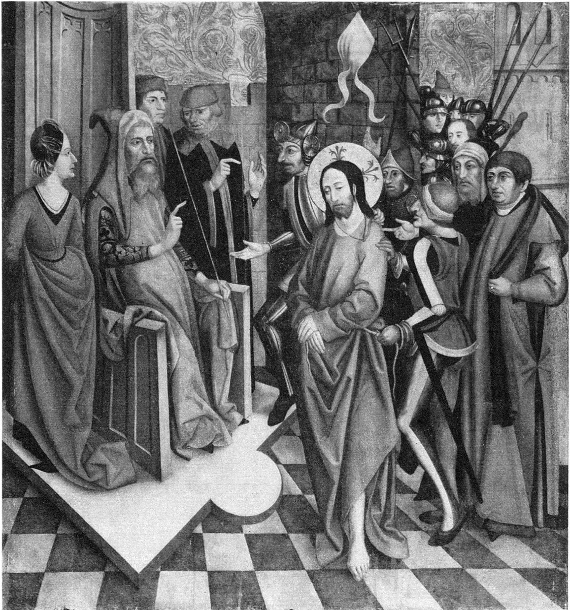
Abb. 5. Christus vor Pilatus, Holz, 137 × 126 cm, Augustinermuseum Freiburg i. Br.

Austreibung der Teufel und die Vertreibung Christi aus dem Tempel; rechts innen die Taufe Christi und das Martyrium des Evangelisten Johannes, außen das kanaanäische Weib, die Speisung der Fünftausend und der Einzug in Jerusalem (Bischöflicher Besitz St. Gallen)